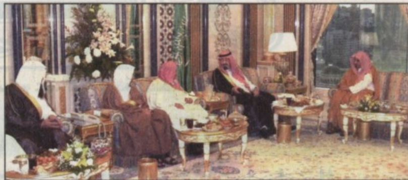
الأمير عبدالله والمشايخ خلال الاستقبال

إيطاليا - واس، رعى صاحب السمو الملكي الأمير محمد بن نواف بن عبدالعزيز آل سعود سفير خادم الحرمين الشريفين لدى إيطاليا ورئيس مجلس إدارة المركز الإسلامي الثقافي في إيطاليا أول من أمس اختتام مسابقة حفظ القرآن الكريم التي تقام تحت رعايته سنوياً ويأشرف رابطة العالم الإسلامي في مقر المركز الإسلامي