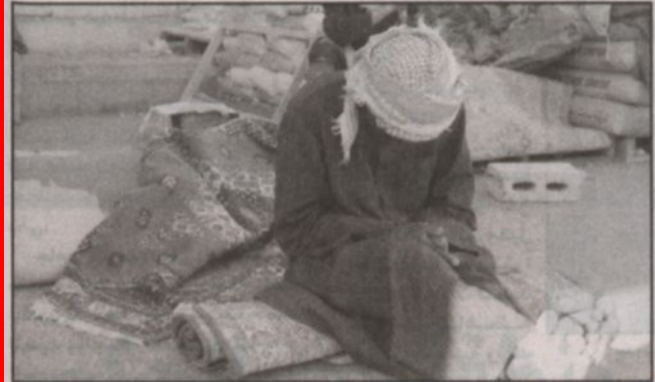
لم يعد له حيلة سوى الجلوس