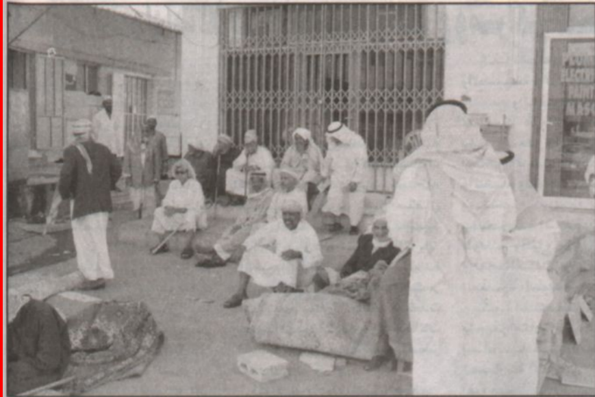
أهالي الحي... ينتظرون مرور أحد المحسنين لمساعدتهم