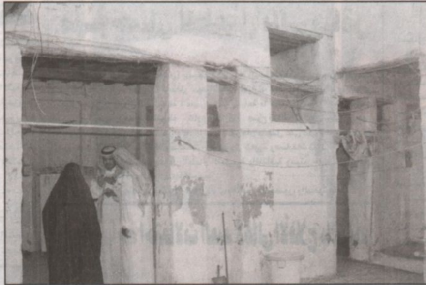
أم فقيرة تتحدث لـ «الرياض»