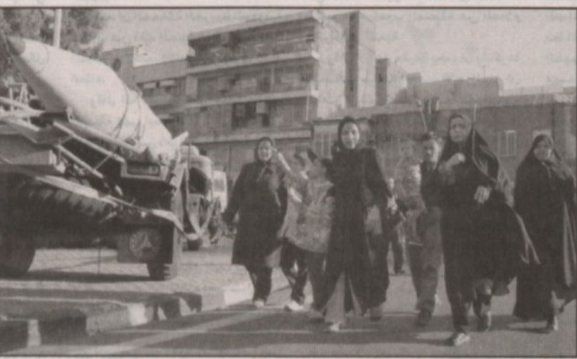
عائلة إيرانية تسير بمحطة (صواريخ شهاب-2) أرض - أرض خلال عرض عسكري ببيمان، بهابنشا، في الذكرى السنوية توجيحه رسالة إلى إيران حول الشأن النووي.

الإيرانية إن إيران لم تطرح شروطاً لاجراء مباحثات مع الوكالة الدولية وانها تعاونت مع الوكالة أكثر من التزاماتها. وقال إن محادثاتنا العملية مع الوكالة ستبدأ يوم الخميس موعدا وصول وفد الخبراء إلى طهران.