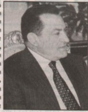
الملك فهد بن عبدالعزيز آل سعود