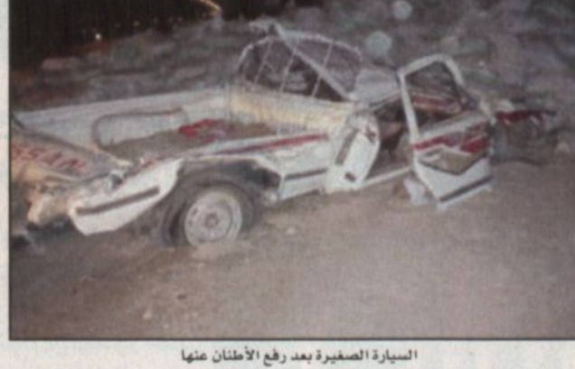
السيارة الصغيرة بعد رفع الأطنان منها

مربانية الشتاء تدخل ثالث أيام العيد كتب - خالد الزيدان، يبدأ ثالث أيام عيد الفطر المبارك الموافق ٧ ديسمبر طالع (مربانية) الشتاء والتي تستمر ٣٩ يوماً من خلال (٣) طوابع زراعية هي طابع الاكليل والقلب والشوكة. وهي أول مربانية الشتاء تشهد البرودة وتسقط أوراق الشجر وتكثر الأمطار والغيوم بأمر الله تعالى كما تتشد الرياح الجبارة ويترعد بها الصبح شمال المملكة والزراعات المتأخرة وسط المملكة. وفيها بطول الليل (٧) دقائق. ومع بداية أيام العيد الموافق ٧ ديسمبر تبدأ هجرة طيور القطا - الكدري - والجوني في طابع الاكليل الزراعي.