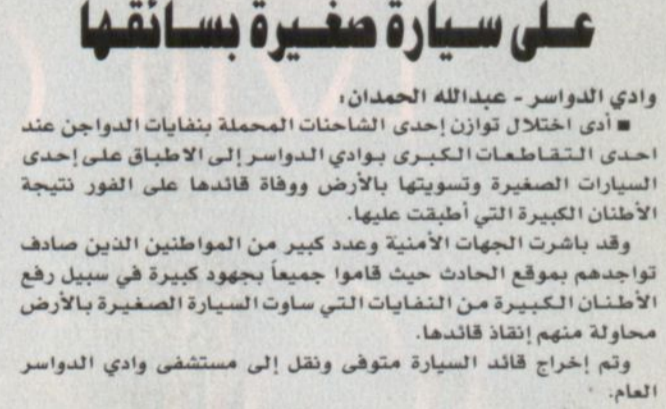
السيارة الصغيرة بعد رفع الأطنان منها

الجمعة أول أيام العيد فلكياً كتب - محمد الفحيلة، أوضح الأستاذ صالح بن محمد الصعب الرئيس السابق لقسم الفلك بمدينة الملك عبدالعزيز للعلوم والتقنية ومدير الإدارة العلمية بمؤسسة الملك عبدالعزيز ورجاله لرعاية الموهوبين ان رؤية الهلال تعتمد على تأخر غروب القمر عن غروب الشمس في مكة المكرمة لبداية الشهر الجديد شهر شوال بعض النظر عن إمكانية الرؤية من عدمها.