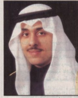
الأمير منصور بن عبدالله

كتب - محمد السهلي، دعماً لصندوق الفقر الذي أعلنه صاحب السمو الملكي الأمير عبدالله بن عبدالعزيز ولي العهد نائب رئيس مجلس الوزراء ورئيس الحرس الوطني بعد جولته التقديرية لعدد من الأحياء الفقيرة بالرياض قدم صاحب السمو الملكي الأمير منصور بن عبدالله بن عبدالعزيز شيكاً بقيمة مليون ريال تبرعاً من سموه لصندوق الفقر. وقد تسلم مساء أمس الأول مندوب معالي وزير العمل والشؤون الاجتماعية الدكتور علي بن إبراهيم التميمي الخاص بترعى سموه، صرح بذلك د. الرياض، مدير عام المكتب الخاص لسمو الأمير منصور بن عبدالله بن عبدالعزيز الأستاذ عايض بن سحيم القحطاني والذي سلم بدوره الشيك إلى مندوب معالي وزير العمل والشؤون الاجتماعية.