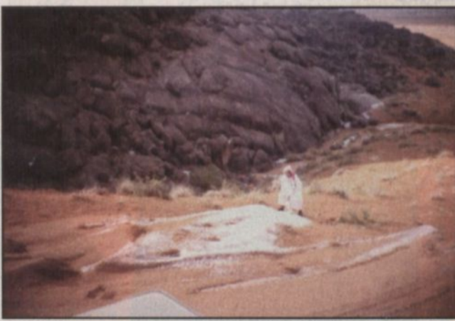
أمطار غزيرة شهدتها القرية على مدى أيام

حائل - خالد العميم، تعرضت قرية الصينية إحدى القرى الصغيرة التابعة لمنطقة حائل مؤخراً لتساقط حبات من البرد غطت معظم أنحاء القرية الواحة غرب مدينة موقوق وقد ساهمت الأسطار في إلحاق الأضرار في ممتلكات القرية من المباني والمزارع التابعة للسكان وذلك لشدة وكثافة تساقط حبات البرد. المواطنون أكدوا ان هذه الأمطار التي تعرضت لها القرية لم يسبق لها مثيل معتبرين تواصل هطول الأمطار على المنطقة بداية عام ربيعي إن شاء الله. يذكر أن منسقة حائل شهدت تواصل هطول الأمطار.