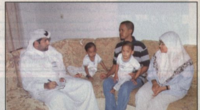
السيارة الصغيرة بعد رفع الأطنان منها

وادي الدواسر - عبدالله الحمدان، أدى اختلال توازن إحدى الشاحنات المحملة بنفايات الدواجن عند إحدى التقاطعات الكبرى بوادي الدواسر إلى الاطيار على إحدى السيارات الصغيرة وتسويتها بالأرض ووقاة قائدها على الفور نتيجة الأطنان الكبيرة التي أطيقت عليها. وقد باشرت الجهات الأمنية وعدد كبير من المواطنين الذين صادف تواجدهم بموقع الحادث حيث قاموا جميعاً بجهود كبيرة في سبيل رفع الأطنان الكبيرة من النفايات التي ساءت السيارة الصغيرة بالأرض محاولة منهم إنقاذ قائدها. وتم إخراج قائد السيارة متوفى ونقل إلى مستشفى وادي الدواسر العام.