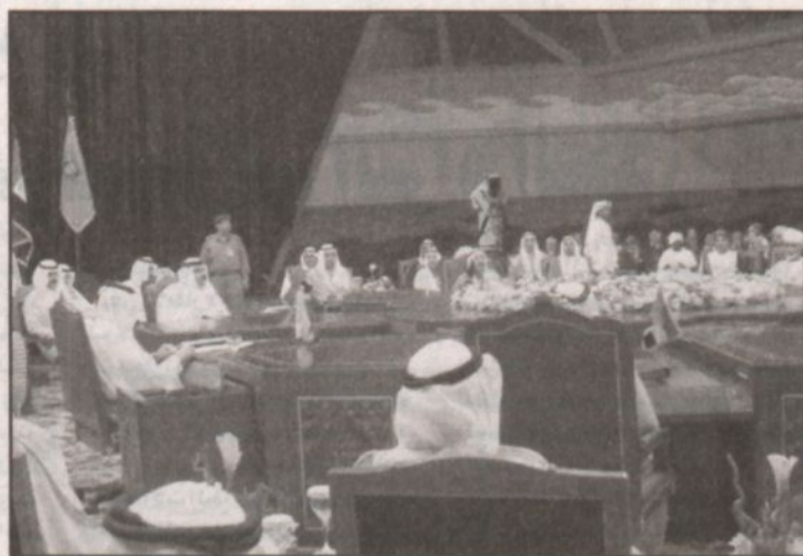
لقطة عامة من الجلسة الافتتاحية للقمة.