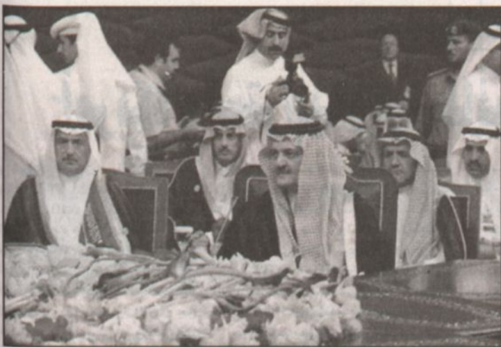
وزير الخارجية السعودي الأمير سعود الفيصل خلال افتتاح قمة مجلس التعاون الخليجي في الدوحة.