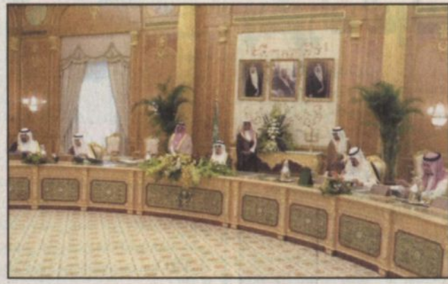
خادم الحرمين مترئساً جلسة مجلس الوزراء

الرياض - واس - رأس خادم الحرمين الشريفين الملك عبد الله بن عبدالعزيز آل سعود - حفظه الله - الجلسة التي عقدها مجلس الوزراء بعد ظهر أمس الاثنين في قصر اليمامة بمدينة الرياض. وفي مستهل الجلسة أعرب خادم الحرمين الشريفين عن تقدير المملكة العربية السعودية حكومة وشعباً لقادة الدول العربية والإسلامية والصديقة وكل من وجه تهنئة للمملكة بمناسبة يومها الوطني الثالث والسبعين على ما عبروا عنه من مشاعر صادقة تجاه المملكة قيادة وحكومة وشعباً. كما أعرب - حفظه الله - عن شكره وتقديره لما عبر عنه مواطنو المملكة من مشاعر صادقة تجلت في هذا اليوم بما يجسد التلاحم الوثيق بين القيادة والشعب في هذا الوطن العزيز. وأوضح معالي وزير الثقافة والإعلام الدكتور فؤاد بن عبدالسلام الفارس في بيانته لوكالة الأنباء السعودية عقب الجلسة أن المجلس استمع وبتوجيه كريم إلى عرض عن زيارة صاحب السمو الملكي الأمير عبدالله بن عبدالعزيز ولي العهد نائب رئيس مجلس الوزراء ورئيس الحرس الوطني للمدينة المنورة والتقلته بأبنائه وأخواته المواطنين وما شملت الزيارة من افتتاح العديد من مشروعات حيوية تخدم هذه المدينة المقدسة كما تعكس الاهتمام البالغ الذي تحظى به من لدن خادم الحرمين الشريفين بهدف التطوير والارتقاء