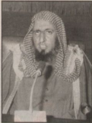
الشيخ عبدالعزيز آل الشيخ

كتب - خالد الزيدان: أكد نائب مفتي عام المملكة وإمام وخطيب جامع الإمام تركي بن عبدالله بالرياض فضيلة الشيخ عبدالعزيز بن عبدالله آل الشيخ أن الماء أمانة انتعنا المولى عز وجل عليها فنبغي المحافظة عليها واستخدامها في سبيلها وحاجاتها الضرورية ونوه فضيلته في تصريح لـ «الرياض» بمناسبة تشييد صاحب السمو الملكي الأمير عبدالله بن عبدالعزيز ولي العهد نائب رئيس مجلس الوزراء ورئيس الحرس الوطني للحملة الوطنية الثانية للترشيد باستخدام المياه بكلمة ضافية بالجهود التي تبذلها الدولة في تأمين المياه وتطهيرها وانفاقها الاموال الطائلة في ذلك.. وأضاف فضيلته: يقول الله جل وعلا: «يا بني آدم خذوا زينتكم عند كل مسجد وكُلوا واشربوا ولا تسرفوا إنه لا يحب المسرفين» ففي هذه الآية أمر من الله بالانقضاء بما أباحه سبحانه لنا من الأكل والشرب ولكن يكون انتفاعنا على أسس العدل والاقتصاد فلا إسراف، لأن الإسراف هو تجاوز الحد في استعمال الباطح، فالأكل أو الشرب الزائد عن حده فهذا أمر منهي عنه لما فيه من الضرر ويشير فضيلته إلى أن الماء نعمة من نعم الله فيقول الله جل وعلا: «ووجعنا من الماء كل شيء حي أفلا يؤمنون» فنعمة الماء يجب أن نقدرها حق قدرها وأن يكون استعمالنا لها على أصول شرعية فالإسراف في استعمال المال أمر