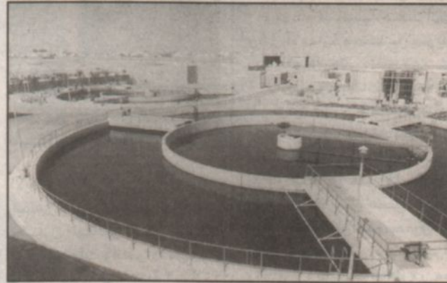
إحدى محطات التحلية في الشرقية