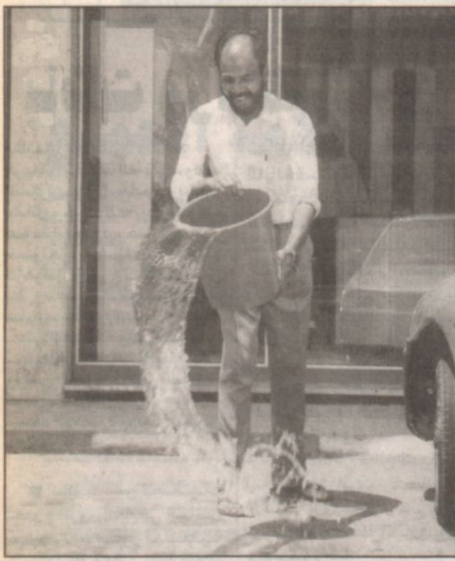
أحد الانعاش السلبية في اهدار المياه

تطلق اليوم (الأحد) المرحلة الثانية من الحملة الوطنية للتوعية بأهمية المياه وضرورة ترشيد استخدامها تحت شعار "لا تسرف في الماء.. فالماء أمانة". وكان معالي وزير الزراعة والمياه الدكتور عبدالله بن عبدالعزيز بن عمر آل سعود - رحمه الله - وحشي عبد خدام الحرمين الشريفين حفظه الله الملك فهد بن عبدالعزيز - سمو ولي عهد الأمين وسمو النائب الثاني حفظهم الله يولون المشاريع المائية جل عناية واعتماد ويدعون كل فرد إلى المحافظة عليها ويبدلون كل جهد في سبيل تأمينها. وقال معالي: إن مصادر المياه بالملكة أربعة مصادر هي المياه الجوفية وكميات مياه الأمطار ومياه البحار المحلاة والاستفادة من مياه الصرف الصحي للمعالج عبر المراحل الثلاث لاستخدامات الزراعية وغيرها دون الشرب. وأكد معالي بأنه صدرت التوجيهات السامية الكريمة عام ١٤١٦ هـ من خادم الحرمين الشريفين وسمو ولي عهد الأمين بإيلاء المياه اهتماماً بالغاً والحرص على إيجاد السبل الكفيلة لإيجادها والترشيد في استخدامها والمحافظة عليها نظراً لأهميتها الحياتية الواردة في قوله تعالى «ووجعنا من الماء كل شيء حي». وتضمن التوجيه أن تتولى وزارة الزراعة والمياه تنظيم حملات مكثفة بالتنسيق مع القطاعات الحكومية والأهلية. وجعل هذه الحملات مصدر توعية للمواطنين والمقيم لتوضيح أهمية هذا الصنف وسبل المحافظة عليه والاستخدام الأمثل.