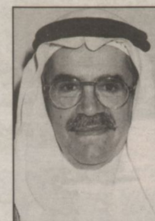
وزير البترول والثروة المعدنية

ثم يتوجه سموه الى رأس تنورة لرعاية حفل مشروع تحديث وتوسعة معمل التكرير في رأس تنورة وذلك في الساعة ٢٣٠ ظهراً.