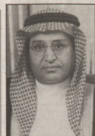
وزير الصناعة والكهرباء

كما يتفضل صاحب السمو الملكي الأمير عبدالله بن عبدالعزيز يوم الثلاثاء القادم بوضع حجر الأساس لمحطة كهرباء غزلان البخارية الثانية وخطوط النقل ومحطات التحويل الخاصة بالمشروع بتكلفة قدرها 6500 مليون ريال ويعتبر مشروع محطة غزلان البخارية الثانية من اكبر المشاريع التي تنفذ حالياً في العالم حيث يتضمن انشاء أربع وحدات بخارية بأنظمتها الساندة لتكون الطاقة الاجمالية لها 2400 ميغاواط، إضافة الى المشاريع الأخرى المساندة.