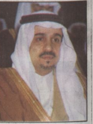
الأمير فيصل بن بندر بن عبدالعزيز واهتمامه بقرية القصيم