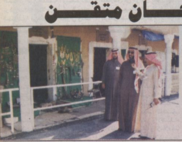
الشيخ المحمود يتحدث للزميل العواد

■ قال فضيلة الشيخ عبدالرحمن المحمود رئيس محاكم دولة قطر إن المهرجان يعد بشكل جيد ومتقن، ويستطيع الزائر مشاهدة الكثير من الهيئات الحكومية ومشاهدة مدى التطور الذي تشهده هذه الدوائر. ونحن في هذه الزيارة للقرية التراثية شاهدنا جميع المعروضات والحرف الشعبية القديمة وشاهدنا حفل افتتاح الجنادرية والذي رعاه سمو ولي العهد فهو حفل متقن وانقى عليه الكثير من الجهد. وقال الشيخ المحمود: إن شيء جميل أن يشاهد الإنسان آثار نهضة هذه المملكة بعد تأسيسها ومرور مائة عام على ذلك ويعيش مع الجو الذي كانت عليه المملكة في بداية التأسيس وجهد الملك عبدالعزيز رحمه الله للتوحيد.