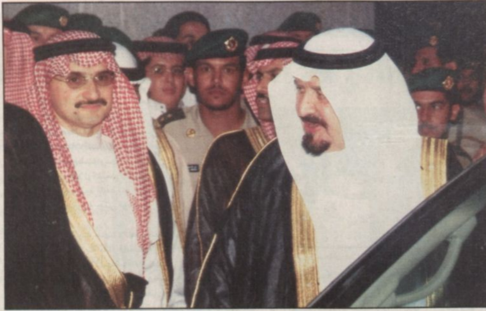
الأمير الوليد يستقبل سمو الأمير سلطان بن عبدالعزيز

وأبان الأمير الوليد بن طلال أنه سيتم ادراج هذا المسجد في كتابة جينيس للأرقام القياسية.