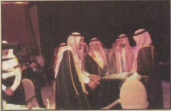
الأمير سلمان يتسلم مجسم برج المملكة من الوليد بن طلال