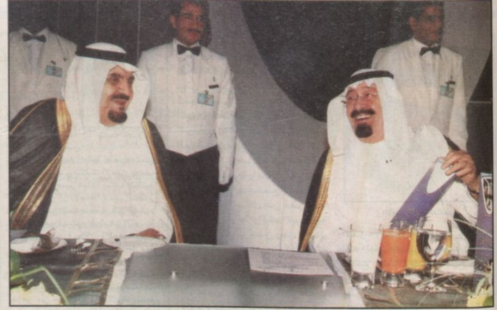
ولي العهد والأمير مشعل في حفل الخطابي لافتتاح برج المملكة