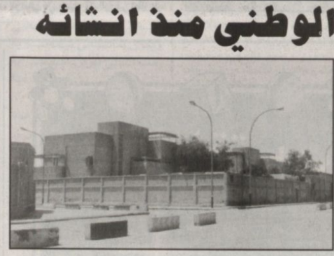
المبنى الثالث لرئاسة الحرس الوطني (في معمار النضويات شارع التلفزيون حالياً) - الرياض