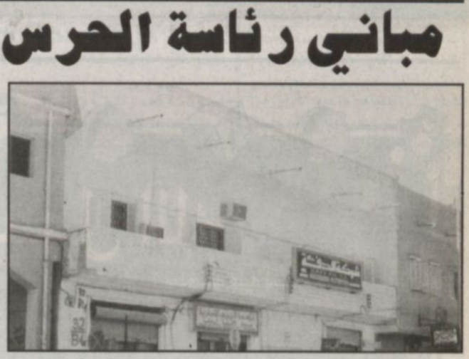
المبنى الأول لرئاسة الحرس الوطني (في شارع الشمسي القديم) - الرياض