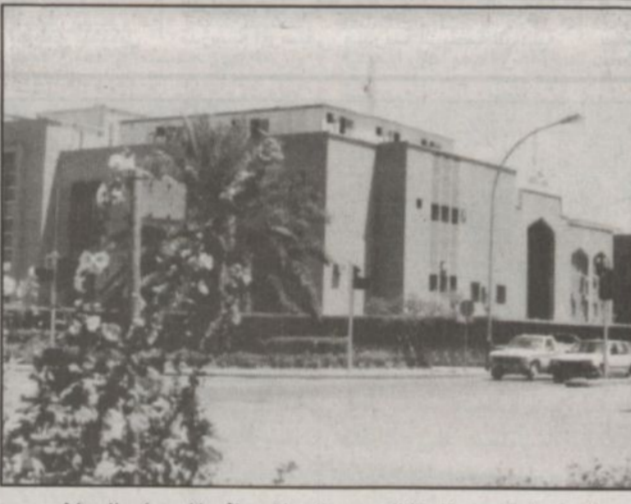
المبنى الرابع لرئاسة الحرس الوطني (في المربع) - الرياض