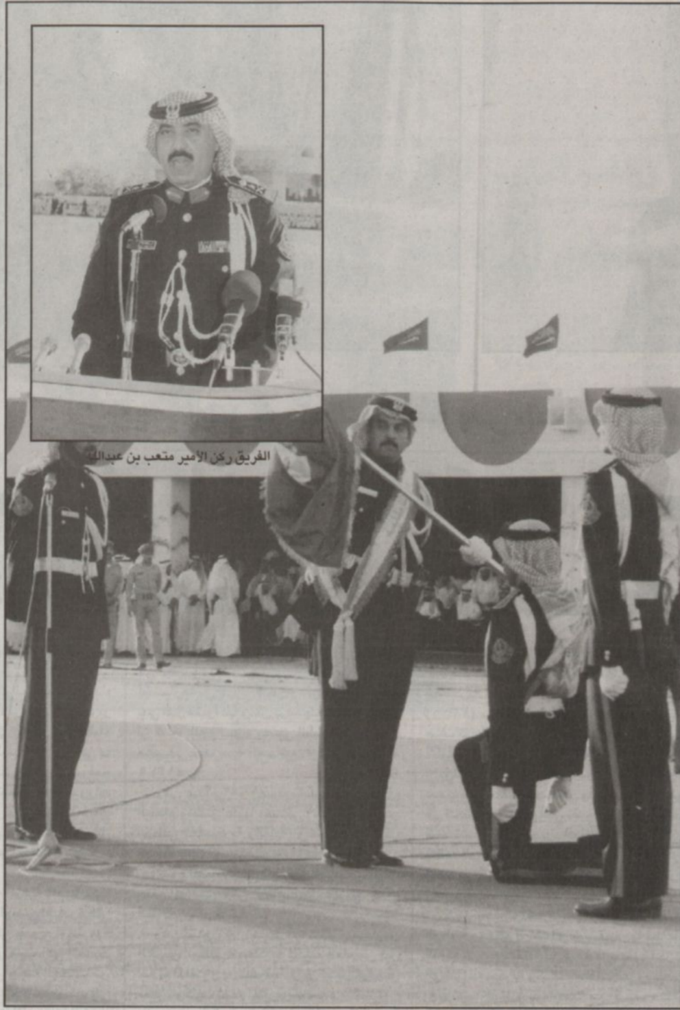
أول دفعة تخرج من كلية الملك خالد العسكرية

الوطني، كما أنيط بها تأهيل الضباط الجامعيين عسكرياً، وخدمة البحث العلمي، والإسهام في خدمة المجتمع. كما تهدف مناهج الكلية إلى تدريب وتعليم الطلاب العسكريين على معظم العلوم العسكرية اللازمة للحصول على المعلومات الأساسية التي تكفل له قيادة وإدارة فصيلة مشاة، إضافة إلى تزويده بحصيلة وإفراة من بعض المعارف والعلوم لتكون سعياً في توسيع مداركه العلمية.