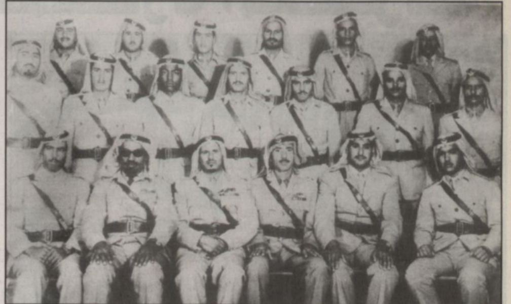
دورة الضباط الأولى عام ١٣٩٧هـ