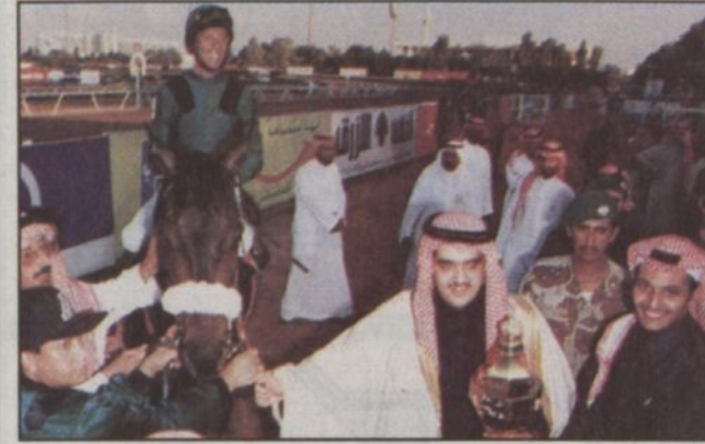
الأمير عبدالعزيز بن فهد والمعجزة (فوز) حامل اللقب الأخير