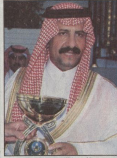
الأمير سلطان بن محمد

فرض الأسطول الأزرق لابناء الأمير محمد بن سعود الكبير هيمته المطلقة على زعامة أسطبلات الانتاج.. التي يتبوأها بكل جدارة واحقية بـ ٤٥ نقطة و (٩) كؤوس يليه الأسطول الأبيض لابناء الأمير عبدالله بن عبدالعزيز بـ ٣١ نقطة و ٤ كؤوس.