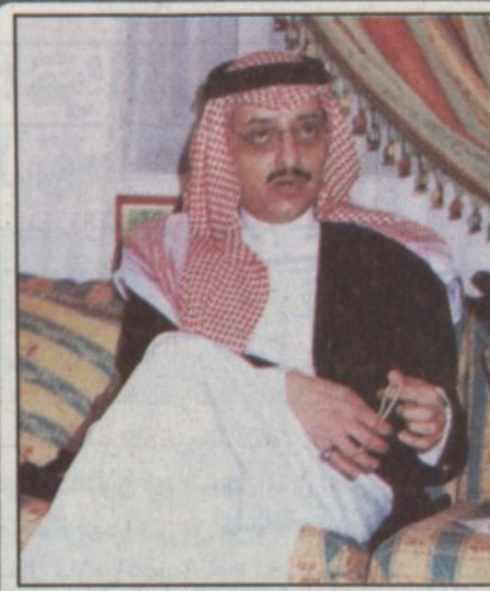
الأمير فيصل بن خالد

يخوض الجواد الأحمر (سنجار) سباق الكأس اليوم لأول مرة باسم أسطبل الأمير فيصل بن خالد بن عبدالعزيز الذي اشتره الشهر الماضي من المالك محمد الحماد بمبلغ مليون ونصف المليون ريال..