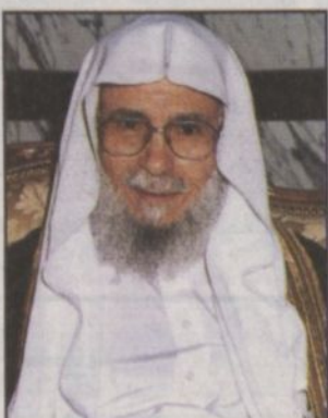
د. عبدالله التركي

الرياض - و.أ.س: نوه معالي وزير الشؤون الإسلامية والأوقاف والدعوة والإرشاد رئيس المجلس الأعلى للجمعيات الخيرية لحفظ القرآن الكريم الدكتور عبدالله بن غانم عبدالعزیز آل براهيم بالرياض بحضور الشيخ محمد بن سعود الإسلامية وإمام وخطيب الجامع والشرف على مختلف مناطق المملكة داعياً له إلى التوفيق والوعون. كما شكر صاحب السمو الملكي الأمير عبدالعزیز بن فهد بن عبدالعزیز وزير الدولة عضو مجلس الوزراء لدمه هذه الدورة واهتمامه بانعقادها كل عام في هذا الشهر المبارك. وأعرب عن شكره وتقديره لمعالي الدكتور عبدالله بن عبدالحسن التركي على متابعته فيما يتعلق بتنظيم هذه الدورة واهتمامه بعقدتها كل عام في شهر رمضان المبارك. وتحدث الشيخ الدكتور صالح السدلان عن الدورة والحلقات التي تتكون منها موضحاً أن فكرة هذه الدورة بدأت منذ عام ١٤١٠هـ وانها في تحسن وتطور مستمرين من حيث التنظيم وزيادة عدد الحلقات من عام إلى عام وقال «انه في هذا العام تم إضافة حلقة جديدة تخصص بتدريس علم القراءات وكان الاقبال عليها كبيراً وله الحمد». عقب ذلك استمع الحضور إلى نماذج مختارة من تلاوات الدارسين تلا ذلك توزيع الجوائز والشهادات على المتقنين ثم الجوائز والشهادات على الدارسين