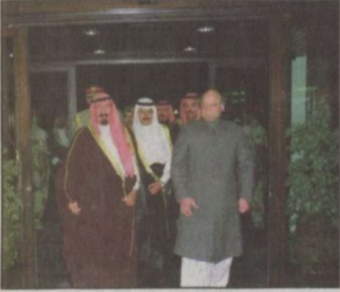
سمو ولي العهد يستقبل رئيس وزراء باكستان.