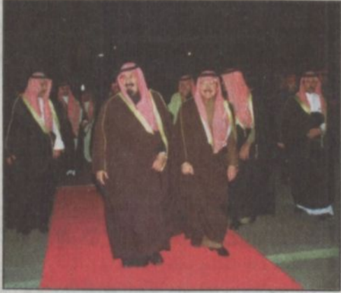
وصول سمو ولي العهد إلى الرياض.

الرياض - جدة، خالد الدماك، واس: يحفظ الله ورعايته وصل صاحب السمو الملكي الأمير عبدالله بن عبدالعزيز ولي العهد ونائب رئيس مجلس الوزراء ورئيس الحرس الوطني إلى الرياض مساء أمس قادماً من جدة.