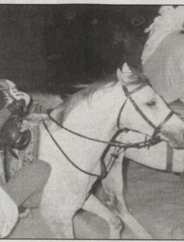
لغة عبيرة تتناول جوانب مهمة في بداية التأسيس

وأعلن الدكتور عبدالعزیز النهار أن شبكة راديو وتلفزيون العرب ستطلق ابتهاجاً بمناسبة المئوية قناة سوف يكون اسمها «قناة المشوية» لتتلق جوانب أخرى مضية من نهضتنا.