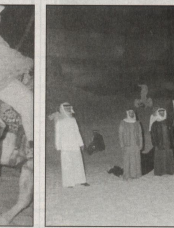
توظيف التراث في العمل الدرامي

هذا وبعد المؤتمر الصحفي انتقل الجميع لقاعة العروض والتي تعتبر تحفة فنية رائعة بديكوراتها البديعة والتي تستحق فعلاً المبالغ والتجهيزات التي صرفت عليها كما أن المجموعات المشاركة في العمل لديها حماس كبير واستعدادات كبيرة للخروج بهذه المناسبة بصورة سريعة.