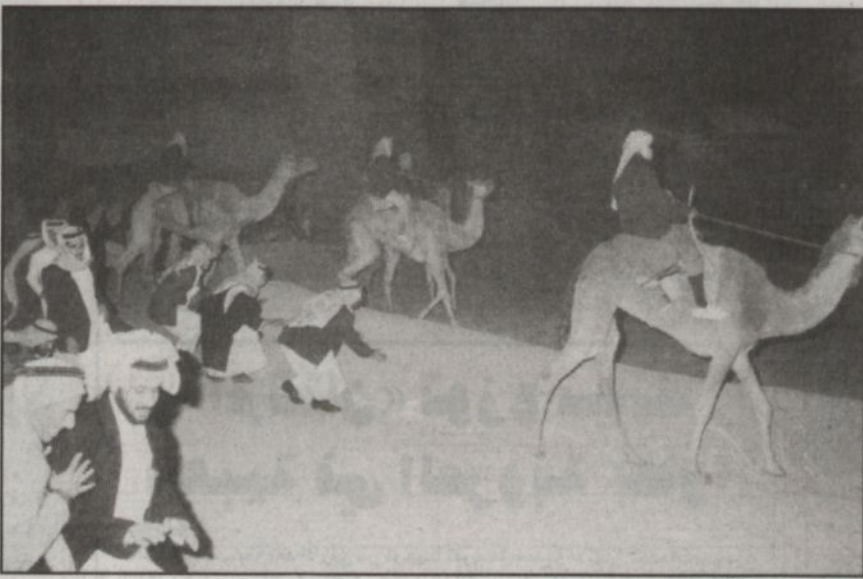
جانب من النواحي الدرامية في الأوبريت