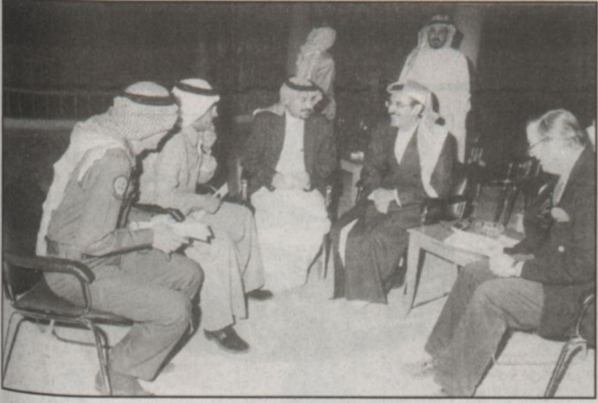
الأمير بدر ود. النهار والخميس ومايكل أثناء الاستعدادات