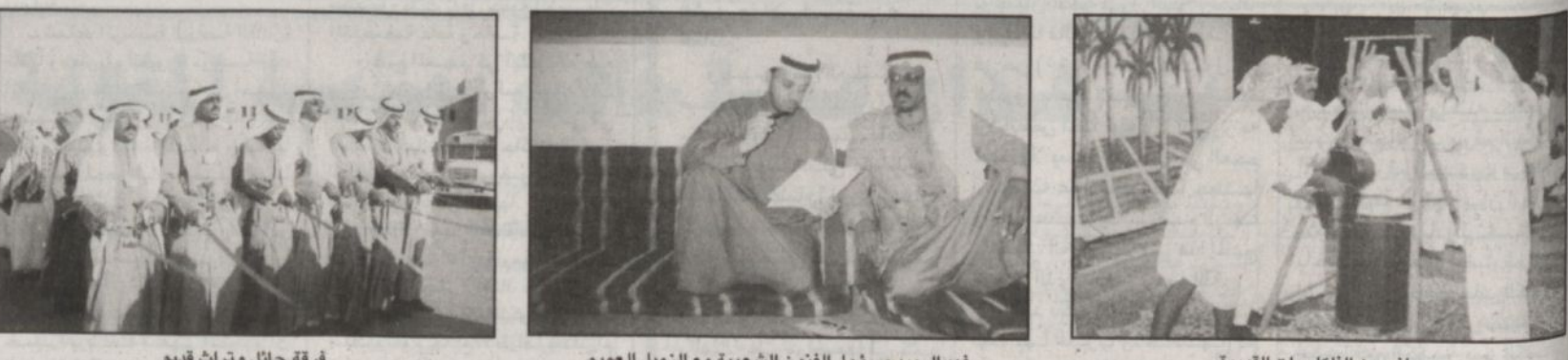
فرقة حائل وتراث قديم