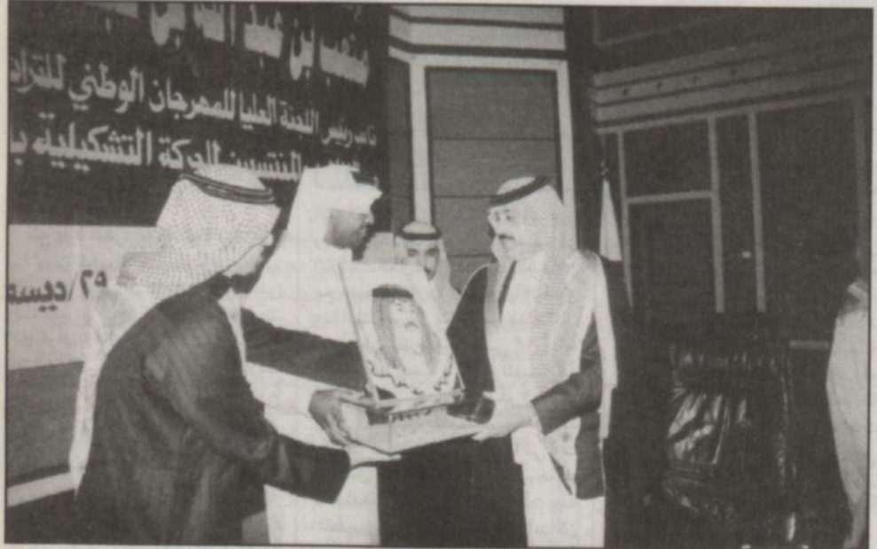
الامير متعب بن عبدالله خلال اللقاء