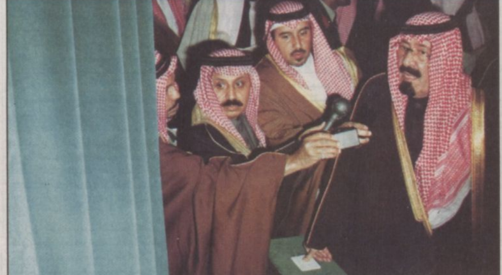
سمو ولي العهد يدشن مشروع الخزن الاستراتيجي

ثم انتقل صاحب السمو الملكي الأمير عبدالله بن عبدالعزيز والحضور إلى موقع حفل الخطابي. ولدى وصول سموه صافح منسوبي المشروع ومدير ومهندسي الشركة المنفذة. «التفاصيل ص ٤» «التقمة صفحة ٦»