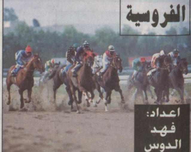
اعداد: فهد الدوس