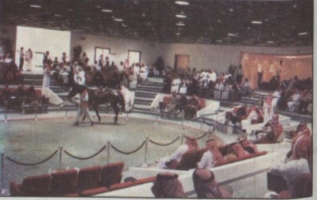
صالة مزاد الخيل من الداخل