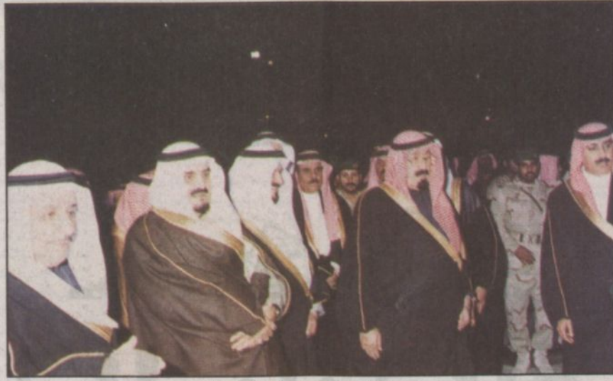
سمو ولي العهد في جناح وزارة المواصلات