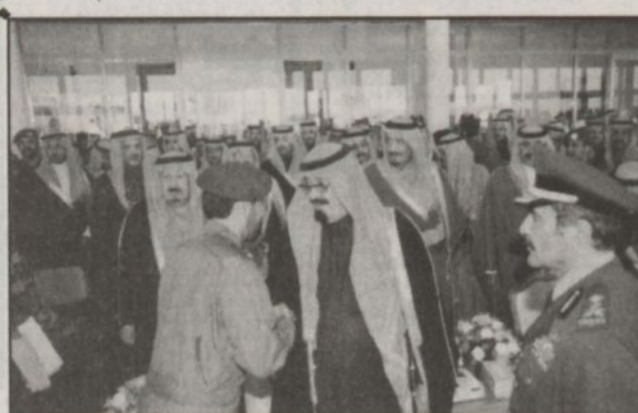
الرائد الزهراني يتشرف بالسلام على سمو ولي العهد (و.ا.س)