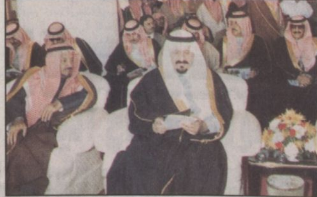
الأمير سلطان خلال الحفل