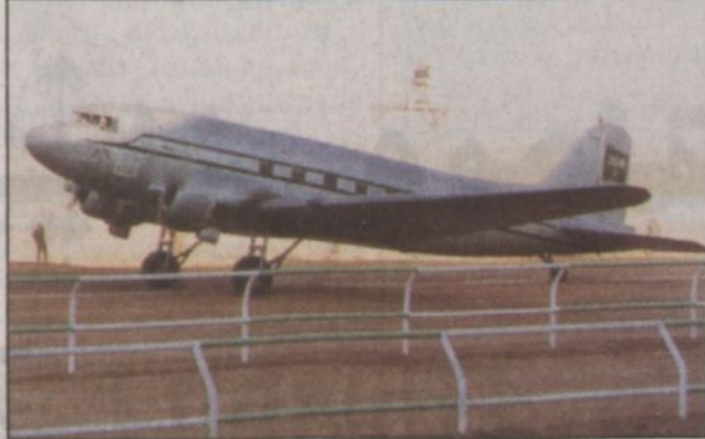
طائرة الملك عبدالعزيز لحظة هبوطها في أرض الجنادرية