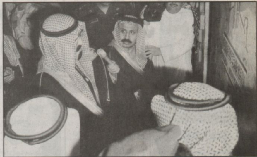
سمو ولي العهد يزيع الستار عن اللوحة التذكارية لقرية منطقة القصيم بالجنادرية