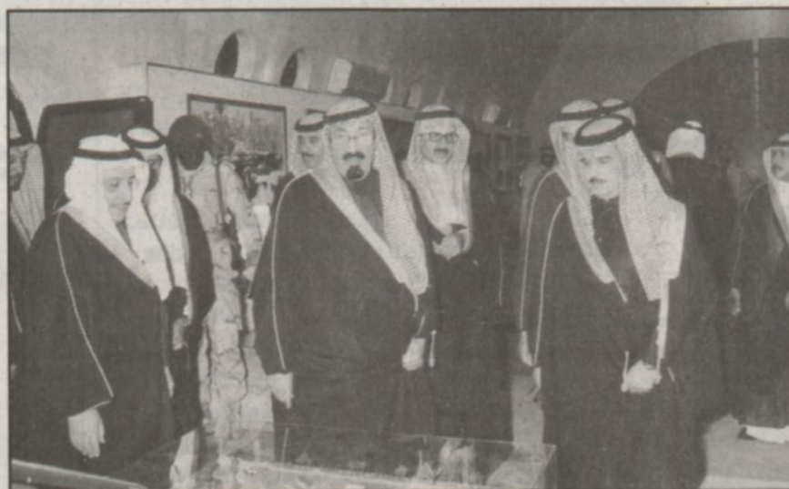
جانب من جولة سمو ولي العهد في جناح وزارة المواصلات