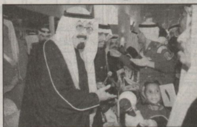
الأمير عبدالله يسلم الفائز الأول في السباق جائزته

وقرر وصول سمو ولي العهد عزف السلام الملكي ثم أخذ سموه مكانه في