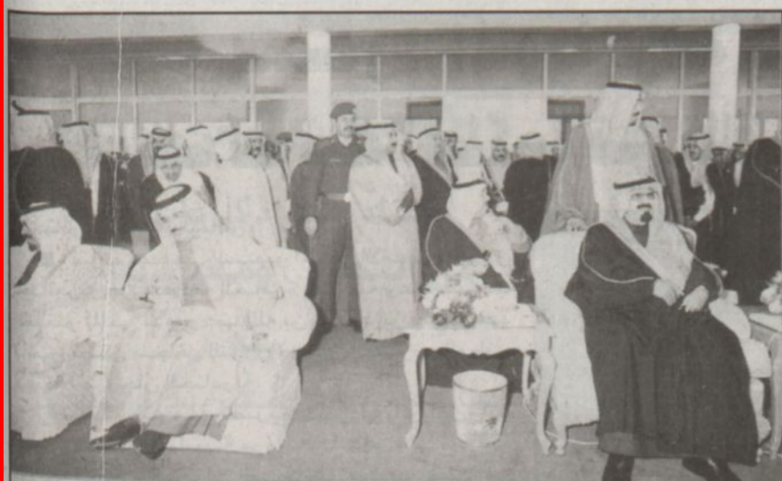
سمو ولي العهد وولي عهد البحرين يتابعان سباق الهجن