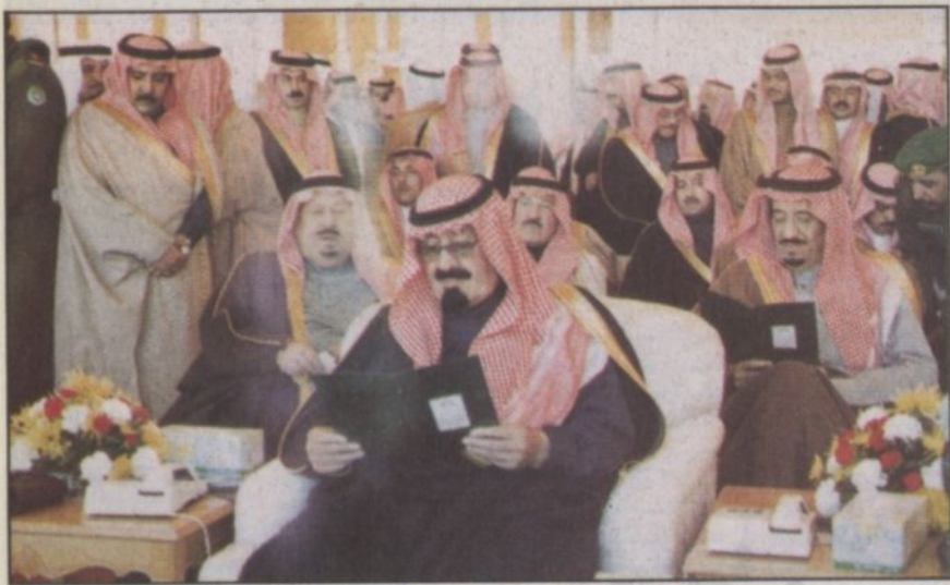
الأمير عبدالله يتابع برنامج سباق الهجن