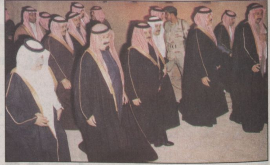
الأمير عبدالله وكبار ضيوف الجنادرية في جولة بقرية القصيم