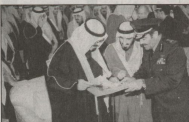
سموه يستمع الى شرح من قائد القوات الجوية (و.ا.س)