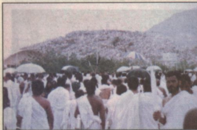
جانب من وقفة الحجيج على صعيد عرفات الطاهر

وقد بدأت قوافل الحجيج في التوجه إلى مزدلفة عبر الطرق السريعة التي انتشر عليها رجال الأمن والمرور والحرس الوطني والكشافة لتساعد الحجاج وتسهيل حركتهم التي اتسعت ولله الحمد بالانسانية.