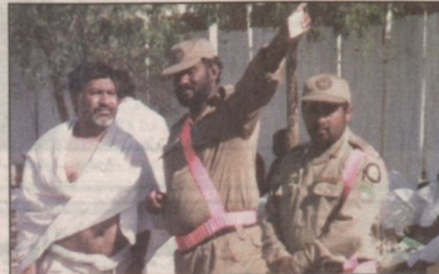
رجال الأمن ساهوا بإغلبية في إرشاد الحجيج

وحدث من مكائدهم الإغراء وما ينسونه للإسلام من أخطاء هو منها براء لانه دين رحمة واحسان وليس دين ارباب وظلم.