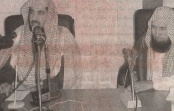
الوزير آل الشيخ خلال المحاضرة

المدينة المنورة - سالم الأحمدى، ■ ألقى معالي وزير الشؤون الإسلامية والأوقاف والدعوة والإرشاد الشيخ صالح بن عبدالعزيز آل الشيخ مساء اول من امس محاضرة بعنوان (ضوابط في منهج التفكير) وذلك في رحاب الجامعة الإسلامية بالمدينة المنورة. وأشار فيها الى المنهج الصحيح للتفكير السليم الذي يؤدي بصاحبه الى قرب من الله عز وجل ويؤدي به أيضاً إلى السير الصحيح الأمن في حياته العلمية والعملية وفي تعامله مع ولاة الأمر من الحكام والاسراء والعلماء واما يكون له الأثر الكبير في نجاته في دنياه واخرته. ولخص معاليه هذا المنهج في الاعتصام بالكتاب والسنة على وفق منهج السلف الصالح والتحذير من الفتنة، وان يكون المنهج صحيحاً ولا عبثاً بالزمن، والتفائل الذي له الأثر في الطمأنينة النفسية وله الأثر في التعليم النافع والتأليف والدعوة إضافة الى ان ما من احد يعمل عملاً إلا وعنده خير يحمد عليه وديناً يذم به. وكذلك ان يكون النظر صواباً في وجود الحسنات