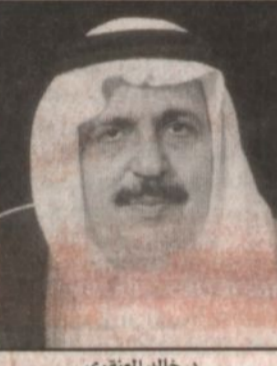
د. خالد العنقري

المدينة المنورة - سالم الأحمدى، أبها - محمد الريبي، ■ يرأس معالي وزير التعليم العالي الدكتور خالد بن محمد العنقري ظهر اليوم الأربعاء بحضور معالي مدير الجامعة الإسلامية بالمدينة المنورة الجلسة الثانية لمجلس الجامعة الإسلامية للعام الدراسي ١٤٢٥-١٤٢٥هـ كما سيحضر الجلسة بقية أعضاء المجلس حيث سيتم مناقشة المواضيع المدرجة على جدول الأعمال. كما يرأس معالي وزير التعليم العالي اليوم الأربعاء الجلسة الثانية لمجلس جامعة الملك خالد للعام الجامعي ١٤٢٥/١٤٢٥هـ وذلك في قاعة مجلس الجامعة بحضور معالي مدير الجامعة الدكتور عبدالله بن محمد الراشد واعضاء المجلس. ويستمر خلال الجلسة مناقشة عدد من القضايا الأكاديمية والإدارية المطروحة على جدول الأعمال.