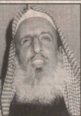
عبدالعزيز آل الشيخ

عمت وطمت نساء الله ان يحاكي المسلمين من هذا البلاد. وقال: لا بد من شيئين ان يسموا منا توجيهات نافعة وكلمات طيبة وتوضح قيمة تكشف لهم الحقيقة وتوضح لهم السبيل وتبين لهم المنهج حتى يستريحوا ويرتاحوا من أن يندفعوا بآراء المضللين ومن لا بصيرة عندهم.