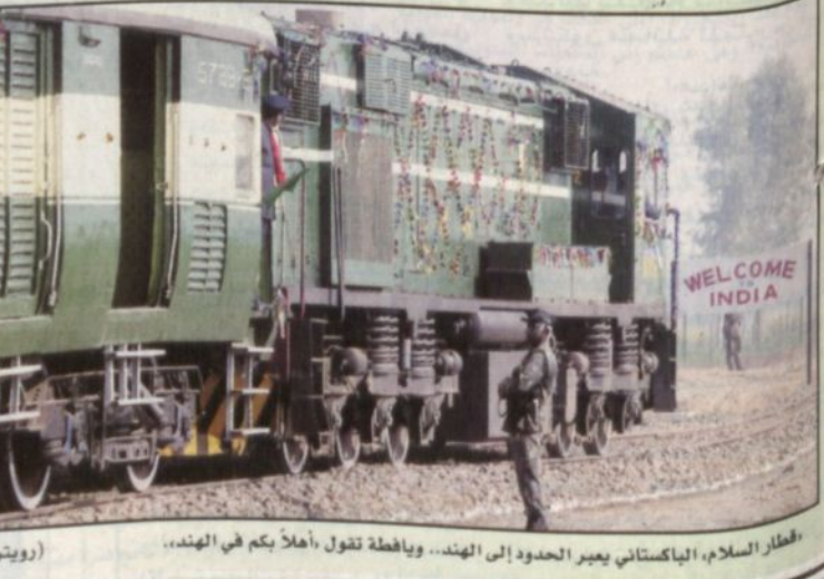
قطار السلام، الباكستاني يعبر الحدود إلى الهند.. ويهاطت تقول أهلاً بكم في الهند،