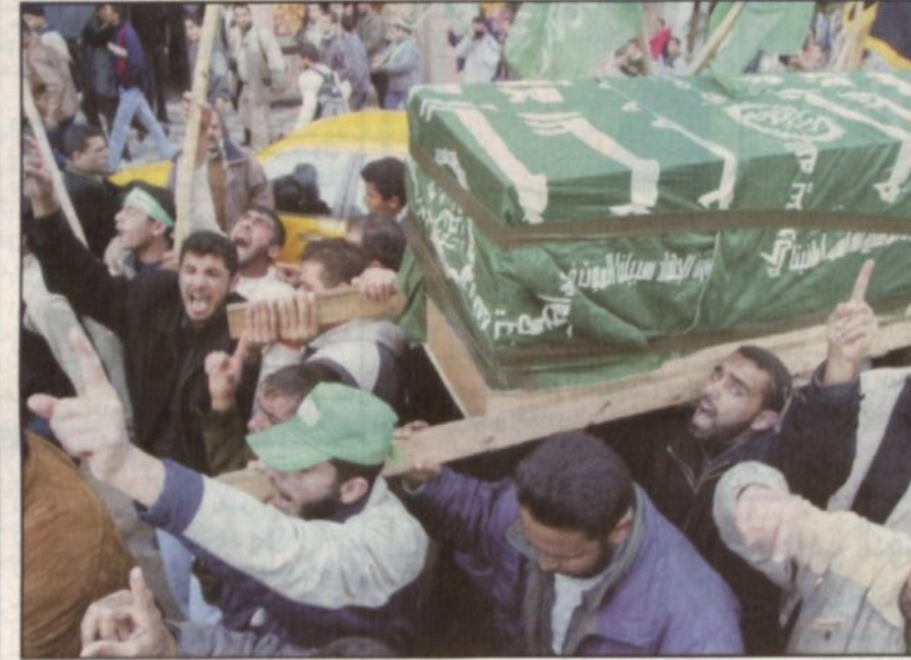
فلسطينيون يشيرون أثناء الاستهائية ريم رياضي في غزة أمس

غزة - مها أبوغوير، رام الله - عبد السلام الريماوي، فرض الجيش الإسرائيلي طوقاً أمنياً صارماً على قطاع غزة المحتل بعد العملية الاستهائية التي نفذتها أم فلسطينية من حركة (حماس) صباح أول من أمس في معبر الإذلال (ايرز) الإسرائيلي ما أدى إلى مصرع أربعة إسرائيليين وجرح عشرة آخرين. وقال متحدث عسكري إسرائيلي ان شاول موفاز وزير الحرب قرر إغلاق القطاع إغلاقاً كاملاً، ما يعني حظر دخول العمال الفلسطينيين إلى الأراض المحتلة منذ العام ١٩٤٨. ومنعت قوات الاحتلال أعضاء في المجلس التشريعي من التوجه إلى رام الله للمشاركة في جلسة المجلس حول الميزانية العامة للسلطة للعام ٢٠٠٤.