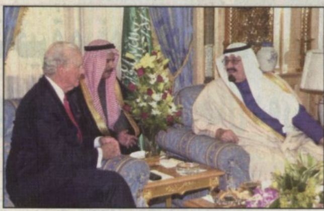
الأمير عبد الله خلال استقباله جيمس بيكر

الرياض - واس: ■ استقبل صاحب السمو الملكي الأمير عبد الله بن عبد العزيز ولي العهد نائب رئيس مجلس الوزراء ورئيس الحرس الوطني في قصر سموه بالرياض أمس معالي وزير الخارجية الأمريكي جيمس بيكر. ونقل معاليه لصاحب السمو الملكي الأمير عبد الله بن عبد العزيز خلال اللقاء تحيات وتقدير فخامة الرئيس جورج دبليو بوش رئيس الولايات المتحدة الأمريكية فيما حملة سمو ولي العهد تحياته وتقديره