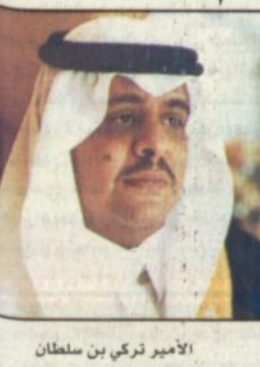
الأمير تركي بن سلطان

مكة المكرمة - خالد عبدالله: ■ يقوم صاحب السمو الملكي الأمير تركي بن سلطان بن عبد العزيز مساعد وزير الثقافة والإعلام خلال الأسبوع القادم بجولة تفقدية على فروع الوزارة بالمشاعر المقدسة يطلع خلالها على الاستعدادات التي اتخذتها الوزارة لتغطية فعاليات موسم حج هذا العام من خلال وسائل الإعلام المقروءة والسماعية والمرئية ونقل هذه الشعيرة إلى مختلف أنحاء العالم عبر الأقمار الصناعية وما جندته الوزارة من إمكانات وطاقت آية ويشيرة للقيام بمهامها الإعلامية ولإبراز الجهود والامكانات والتسهيلات التي سخرتها المملكة لخدمة حجاج بيت الله الحرام. كما سيتطلع سموه مساعد وزير الثقافة والإعلام على الامكانات التي وفرتها الوزارة لوسائل الإعلام المختلفة المشاركة في تغطية موسم حج هذا العام وللبعثات الإعلامية التي تشارك في هذا الحدث الإسلامي الكبير.