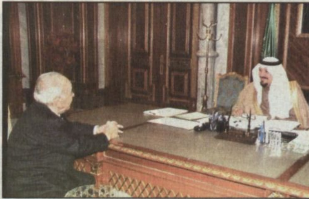
الأمير سلطان يستقبل السفير التونسي

كتب - مندوب «الرياض»: ■ تلقى الأمين العام لمؤسسة الأمير عبد الله بن عبد العزيز لوالديه للإسكان التنموي الدكتور يوسف بن أحمد العثيمين خطاب شكر وتقدير من صاحب السمو الملكي الأمير سلطان بن عبد العزيز النائب الثاني لرئيس مجلس الوزراء وزير الدفاع والطيران والمفتش العام وذلك إثر تلقي سموه نسخة من التقرير السنوي للمؤسسة عن السنة التأسيسية. ودعا سمو النائب الثاني - حفظة الله - للمؤسسة بالتفوق في القيام بأداء رسالتها الخيرية التي أنشأها سمو ولي العهد - حفظة الله - من أجلها، كما تمنى سموه رعاة الله - للعاملين فيها التوفيق والسداد.