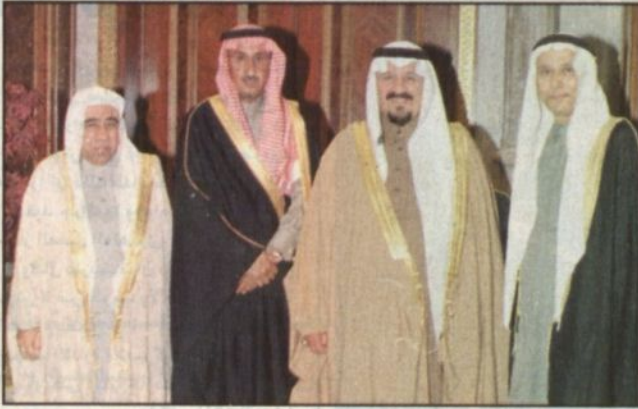
سمو خلال استقباله السامري (و.أ.س)

■ قام صاحب السمو الملكي الأمير سلطان بن عبد العزيز النائب الثاني لرئيس مجلس الوزراء وزير الدفاع والطيران والمفتش العام مساء أمس الأول بزيارة لعائلة آل صالح لتقديم العزاء في وفاة عميد أسرة آل صالح الشيخ عبد الرحمن بن إبراهيم آل صالح وقد كان في استقبال سموه أبناء الفقيد وأقاربه وعبر الشيخ سعد آل صالح أكبر أبناء الفقيد عن شكره وتقديره لسمو الأمير سلطان على هذه الفتنة وإن هذا ليس مستغرباً من سموه فهو دائماً صاحب المبادرات الانسانية رغم مشاغله الكثيرة. وكان الفقيد الشيخ عبد الرحمن بن إبراهيم بن محمد آل صالح قد انتقل إلى رحمة الله تعالى يوم الأحد الماضي عن عمر يناهز المائة سنة وكان أحد رجالات الملك عبد العزيز رحمه الله، وقد أدى الصلاة عليه جمع من المصلين وشارك في أداء الصلاة صاحب السمو الأمير عبد الرحمن بن عبد الله بن عبد الرحمن وصاحب السمو الملكي الأمير سلمان بن عبد العزيز أمير منطقة الرياض وصاحب السمو الملكي الأمير عبد العزيز مساعد وزير الدفاع والطيران والمفتش العام للشؤون العسكرية وصاحب السمو الأمير سلطان بن محمد بن سعود الكبير وصاحب السمو الملكي الأمير سلطان بن سلمان بن عبد العزيز أمين عام الهيئة العليا للسباحة.