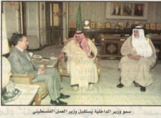
سمو وزير الداخلية يستقبل وزير العمل الفلسطيني

الرياض - واس: ■ استقبل صاحب السمو الملكي الأمير نايف بن عبد العزيز وزير الداخلية بمكنتيه في الوزارة أمس معالي وزير العمل الفلسطيني عثمان عبد الوهاب الخطيب ووكيل وزارة العمل المساعد للشؤون العمالية الفلسطينية محمد محمود الصباح. وتم خلال اللقاء بحث عدد من الموضوعات ذات الاهتمام المشترك بين البلدين الشقيقين. وحضر اللقاء معالي وزير العمل والشؤون الاجتماعية الدكتور علي بن إبراهيم النماش ووكيل وزارة العمل والشؤون الاجتماعية لشؤون العمل أحمد بن منصور الزامل ومدراء عامات المنظمات الدولية عبد العزيز الهذلي وسفير دولة فلسطين لدى المملكة مصطفى هاشم الشيخ ديب. من جانب آخر استقبل صاحب السمو الملكي الأمير نايف بن عبد العزيز بمكنتيه في وزارة الداخلية بالرياض أمس سفير الجمهورية الإسلامية الإيرانية لدى المملكة علي أصغر حاجي. وتم خلال اللقاء بحث عدد من الموضوعات ذات الاهتمام المشترك بين البلدين الشقيقين. وحضر اللقاء مدير عام مكتب سمو ولي العهد الدكتور ناصر بن عبد العزيز آل سعود بن صالح الداود.