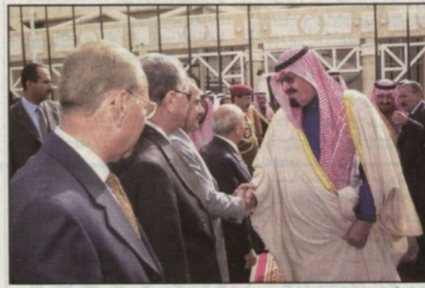
الأمير عبدالله في وداع الرئيس علي صالح والوفد المرافق (د.و.ا.س.)

الرياض - واس، رويترز، غادر الرئيس علي عبدالله صالح رئيس الجمهورية اليمنية الشقيقة الرياض بعد ظهر أمس مستتماً بزيارة للمملكة استمرت يومين. وكان على رأس مودعي الرئيس صالح بمطار قاعدة الرياض الجوية أخوه صاحب السمو الملكي الأمير عبدالله بن عبدالعزيز ولي العهد نائب رئيس مجلس الوزراء رئيس الحرس الوطني. وأعلن بيان مشترك صدر في