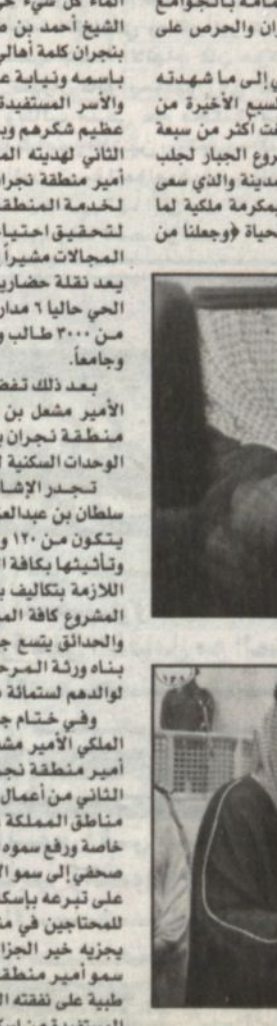
الدكتور عبدالله الجفري