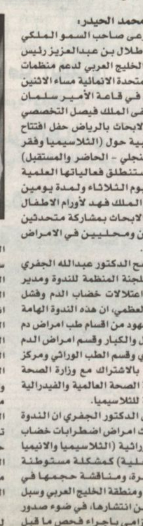
الدكتور عبدالله الجفري