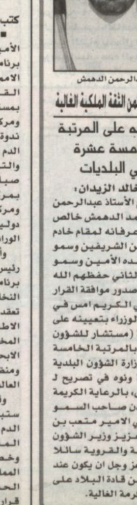
الدكتور خالد الشريه