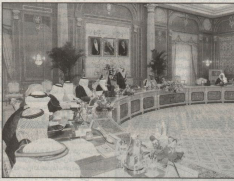
سمو ولي العهد يترأس جلسة مجلس الوزراء (واس)

ورئيس الحرس الوطني سمو ولي العهد نائب رئيس مجلس الوزراء ورئيس الحرس الوطني - حفظه الله - تحدث عن الوضع الراهن في الأراضي الفلسطينية المحتلة والممارسات العدوانية الاسرائيلية المتكررة على الشعب الفلسطيني ورموزه الوطنية وما أحدثه ويحدثه ذلك من تضرر للاوضاع في فلسطين. وكرر - حفظه الله - نداءاته لدول العالم والمجتمع الدولي لوضع حد للممارسات الاسرائيلية غير الانسانية وعدوانها للساكنين على ابناء الشعب الفلسطيني وارغام اسرائيل على الانصياع لمختلف القرارات الدولية. وشدد سمو ولي العهد على أن عدم اتخاذ موقف دولي حازم وصارم ضدها شجعها على التمادي في اعمالها العدوانية وسعيها نحو افشال أي مسمى نحو تحقيق السلام في المنطقة. وهي الشأن الداخلي تطرق المجلس الى التطور الذي وصل اليه تعليم المرأة في المملكة العربية السعودية حيث تجاوز عدد الطالبات في مراحل التعليم العام والمليونين وثلاثمائة الف طالبة مشيرة الى أن ما وجه به صاحب السمو الملكي الأمير عبدالله بن عبدالعزيز ولي العهد ونائب رئيس مجلس الوزراء