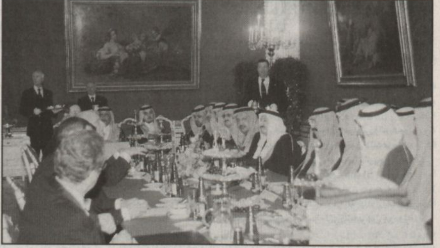
سمو ولي العهد أثناء تروسه الجانب السعودي في المباحثات النمساوية