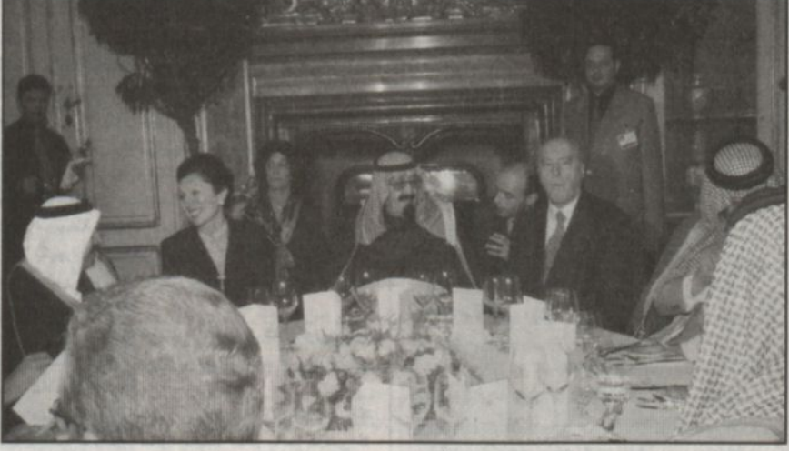
الأمير عبدالله مشرفاً حفل الغداء للرئيس النمساوي