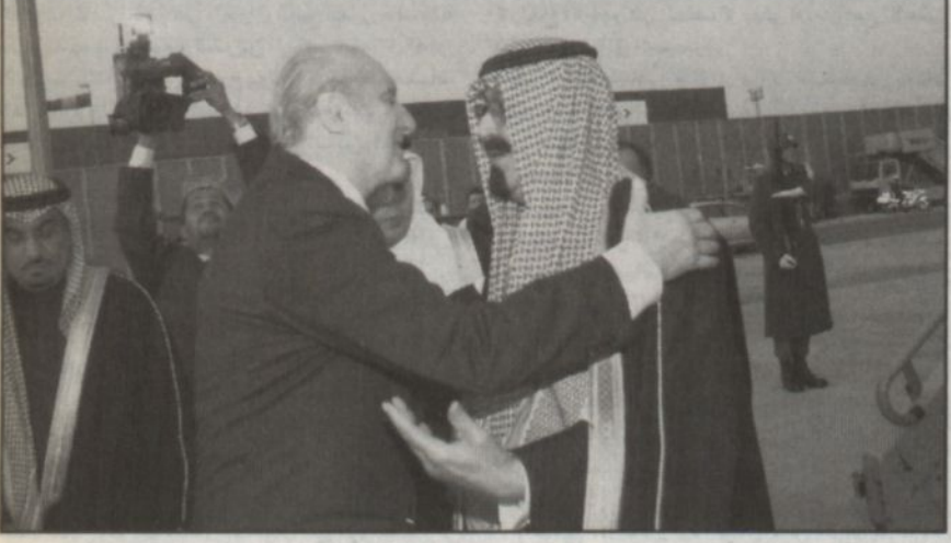
وصول سمو ولي العهد النمسا