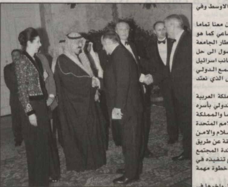
حفل الغداء الذي أقيم تكريماً لسمو ولي العهد

ثم التقى صاحب السمو الملكي الأمير عبدالله بن عبدالعزيز الكلمة التالية فخامة الرئيس الدكتور توماس كلستيل رئيس جمهورية النمسا أصحاب المعالي والسعادة.. السلام عليكم ورحمة الله وبركاته.. أود أن أشكركم يا فخامة الرئيس على المشاعر الكريمة التي تفضلت بها نحو المملكة العربية السعودية وقبائدها وشعبها مؤكداً لكم أننا نبادلكم هذه المشاعر الاخوية الرقيقة. فخامة الرئيس.. يسعدني ويسعد زملائي في الوفد أن نقوم بهذه الزيارة إلى النمسا البلد الصديق ويسعدنا أن نكون في فيينا عاصمتها الجميلة التي تحمل مطر التاريخ المجيد لقد لعبت النمسا دوراً هاماً في تاريخ أوروبا وتاريخ العالم وكانت جزءاً من امبراطورية وتمكنت من أن تتعامل مع المتغيرات وأن تتحول إلى دولة عضوية بنت لمواظبتها مجتمع الرفاه دون أن تتخلى عن ملامحها أو هويتها التاريخية اننا نراقب التجربة النمساوية بأعجاب بالغ ونرى فيها نموذجاً رائعاً للجمع بين الإصالة والمعاصرة.. فخامة الرئيس.. أحب أن أستهز هذه الفرصة مؤكداً لشخامتكم أن الاسلام الدين الذي نعتز بالانتماء اليه ونعتبر أحكامه دستوراً يحكم تصرفاتنا الجماعية والفردية هو دين السلام والصحة والتسامح.. ان الارهابيين الذين يسفكون الدماء البريئة ليسوا سوى قلة قليلة من المنحرفين الذين يثير أصدافنا في كل مكان ان الارهاب لا هوية له ولا عقيدة ينتمي اليها فكل أمة يوجد بها اراهابيون لا يعبرون بأي حال عن هويتها وأحب أن أعرب عن فقتي المحلقة أن قوى الخير والاعتدال والتسامح سوف تتمكن بعون الله من هزيمة دعاة الحقد والكراهية والتعصب.