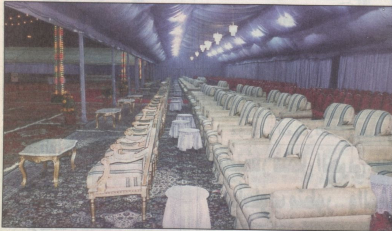
شبكة أفرح الرياض