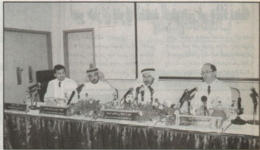
د. الربيعة خلال المؤتمر الصحي