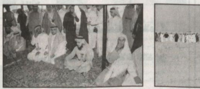
قبيلة آل عاتف يتضرر لطلب الصلح من قبيلة آل حارث

كما ورد في شرح احد الصور تحليف احد الشهود وهو ليس من المصلحين وليس من الشهود. وبين ان قبيلة آل حارث الفهر تنازلوا عن سيارة