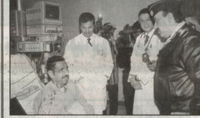
الفريق أول ركن متعب بن عبدالله وحديث مع المواطن العنزي داخل غرفة العلاج المركز

وتحقيق المزيد من الانجازات لهذا البلد. ونقل شكر سمو ولي العهد للفريق الطبي على هذا الانجاز معتبراً ان هذا امتداد لانجازات الوطن المتتالية.