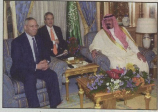
سمو ولي العهد يستقبل وزير الخارجية الأمريكي (و.أس)

من أجل خدمة شعب هذا البلد مؤكداً سموه ان هذه الإصلاحات نابعة من الداخل وهي تشمل جميع احتياجات الشعب السعودي، مشيراً سموه إلى ان توقيت تنفيذ هذه الإصلاحات يتوقف على ما يمكن إنجازه حسب القدرة والامعان الذي يمكن ان يحققه من أجل جهود الإصلاح حتى يصبح الإصلاح قوة موحدة لهذا البلد وليس قوة مفككة له حيث أننا نريد ان نبقي على وحدة وتماسك بلادنا. وكشف سموه أنه تم الإفراج عن بعض الأشخاص الذين تم إيقافهم مؤخراً لإصدارهم بيانات لا تخدم وحدة الوطن وتماسكه بعد ان التزموا بعدم استخدام أسماء الآخرين في إصدار مثل هذه البيانات وقال سموه من وجهة نظرنا فإن ما حدث شيء يتعلق بهذا البلد ومن أجل مصلحته وهؤلاء الأشخاص حاولوا ان ينشقوا والبلد بكامله كان يتطلع إلى الرؤية الحقيقية والجيدة خاصة عندما يواجه تهديداً إرهابياً وهذا ليس الوقت من أجل الانتفاخ.