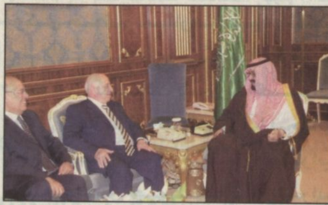
الأمير عبدالله بن سعود يستقبل قريح

الرياض - واس: استقبال خادم الحرمين الشريفين الملك فهد بن عبدالعزيز آل سعود في مكتبه بقصر اليمامة أمس دولة رئيس وزراء فلسطين أحمد قريح. وقد نقل دولته لخادم الحرمين الشريفين تحيات وتقدير فخامة الرئيس ياسر عرفات رئيس دولة فلسطين.. كما حمله - أيد الله - تحياته وتقديره لفخامته. وجرى خلال الاستقبال بحث مجمل الأوضاع على الساحتين العربية والإسلامية والدولية خاصة القضية الفلسطينية وما يتعرض له الشعب الفلسطيني الشقيق من قتل وتدمير وحصر على أيدي القوات الإسرائيلية.. والتأكيد على حق الشعب الفلسطيني في إقامة دولته المستقلة وعاصمتها القدس. كما استقبال صاحب السمو الملكي الأمير عبدالله بن