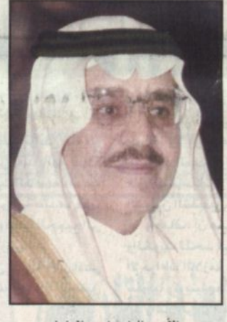
الأمير نايف بن عبدالعزيز

الرياض - واس، نفي مصدر مسؤول في وزارة الداخلية ما نشرته إحدى الصحف بأن صاحب السمو الملكي الأمير نايف بن عبدالعزيز وزير الداخلية قد تبرع لاحد الأندية الرياضية بمبلغ مائة الف ريال. وأوضح المصدر أن هذا الخبر عار من الصحة وسموه لم يقدم أي تبرع وجميع الأندية الرياضية في المملكة تجد من سموه كل تقدير وإهتمام من واقع ما تقوم به الأندية لدعم المنتخبات الوطنية لما فيه رفعة شأن بلادنا في المحافل الدولية الرياضية.