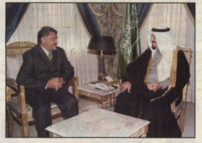
الأمير سلطان يستقبل وزير التجارة اليمني

الرياض - واس، تسلم صاحب السمو الملكي الأمير سلطان بن عبدالعزيز النائب الثاني لرئيس مجلس الوزراء وزير الدفاع والطيران والمفتش العام أمس رسالة خطية من دولة رئيس مجلس الوزراء بالجمهورية اليمنية الدكتور عبدالقادر باجمال. وقام بتسليم الرسالة لسمو النائب الثاني معالي وزير التجارة والصناعة بالجمهورية اليمنية الدكتور خالد راجع شيخ خلال استقبال سموه له أمس في قصر سموه بالمنذر. وحضر الاستقبال معالي وزير الدولة وعضو مجلس الوزراء الدكتور مساعد العبيان والسفير اليمني لدى المملكة خالد بن اسماعيل الأكاوع.