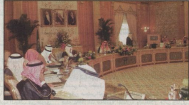
سمو ولي العهد يترأس جلسة مجلس الوزراء

لمجلس جامعة الدول العربية التي اختتمت في القاهرة مؤكداً في هذا الخصوص على ضرورة تفعيل العمل العربي المشترك والسعي نحو تحقيق القدرة الكاملة للجامعة العربية لمواجهة ما يحق بالآلة العربية من تحديات وتطور متلاحق ومتسارع للأحداث ليس على صعيد المنطقة حسب بل والعالم كافة تظهر تداعباتها بجلاء على العالم. واختتم الوزير الفارسي بيانه مقبداً أن المجلس اثر اطلاعه على جملة من القرارات على ملي. بعد الاطلاع على ما رفعه صاحب السمو الملكي النائب الثاني لرئيس مجلس الوزراء وزير الدفاع والطيران والمفتش العام ورئيس اللجنة الوزارية لتنظيم الاداري بشأن التوصيات التي انتهت اليها اللجنة الوزارية لتنظيم الامور لاعادة تنظيم قطاع الطيران المدني قرر مجلس الوزراء الموافقة على توصيات اللجنة الوزارية لتنظيم الاداري لاعادة تنظيم قطاع الطيران المدني قرر مجلس الوزراء الموافقة على توصيات اللجنة الوزارية لتنظيم الاداري سالفه الذكر وفق الصيغة التوضيحية المبينة في القرار. ومن أبرز ملامح هذا القرار ما يلي: أولاً: تحويل رئاسة اللجنة المدنية إلى هيئة عامة ذات شخصية اعتبارية واستقلال مالي وإداري. ثانياً: تدير الهيئة أعمالها وفق معايير تجارية مع مراعاة عدد من الصوابم الواردة في القرار. ثالثاً: إخضاع جميع منسوبي هيئة