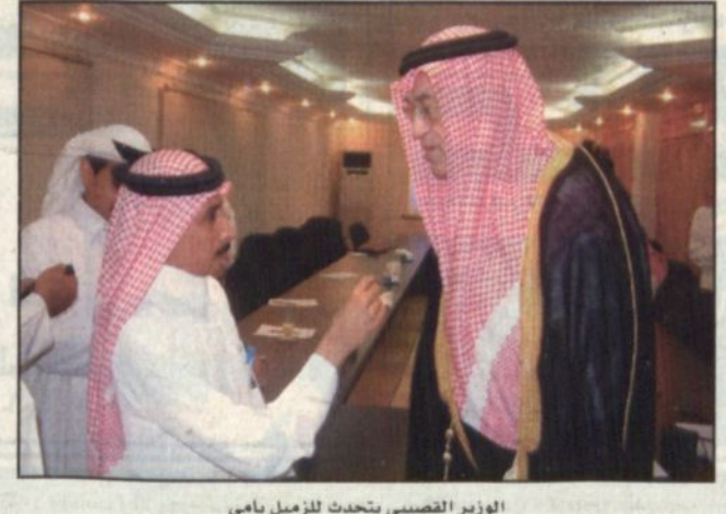
الوزير القصبي يتحدث للزميل يامي

اعتماد المرحلة الثانية لتوسعة محطة تحلية المياه في جزيرة فرسان يجري تنفيذها حالياً. وفيما يتعلق بسد وادي بيش قال ان ميزانية هذا العام ولله الحمد حملت تنفيذ واحد من أكبر السدود بالمملكة وهو سد بيش والذي تبلغ طاقته التخزينية حوالي (١٩٤) مليون متر مكعب كما اعتمدت ميزانية منذ العام تنفيذ مشروع محطة تنقية المياه لمدينة جازان مشيراً إلى ان التكلفة الاجمالية للمشاريع المياه ومحطات التنقية والصرف الصحي والسدود في المنطقة تبلغ حوالي ٧٠٠ مليون ريال. وأشار معاليه إلى ان لدى الوزارة العديد من المشاريع والمقترحات لتوفير المياه ودعم مصادرها كما هو الحال بالنسبة للكهرباء.