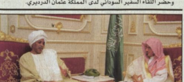
الأمير سطاتم خلال الاستقبال (واس)

الرياض - واس، استقبل صاحب السمو الملكي الأمير سطاتم بن عبدالعزيز نائب أمير منطقة الرياض في مكتب سموه بقصر الحكم أمس معالي وزير مجلس الوزراء السوداني اللواء ركن الهادي عبدالله العوض الذي يزور المملكة حالياً. وتم خلال اللقاء استعراض علاقات التعاون بين البلدين الشقيقين وسبل تعزيزها في شتى المجالات. وحضر اللقاء السفير السوداني لدى المملكة عثمان الدرديري.