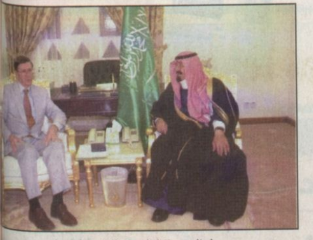
ولي العهد يستقبل المبعوث الفرنسي (و.ا.س)

حضر الاستقبال سفير فرنسا لدى المملكة برنارد بولتي.