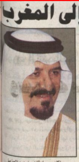
الامير سلطان بن عبدالعزيز

وعن المميزات التي تضمنها النظام الجديد أكد الثنيان ان النظام الجديد يحتوي على مميزات كثيرة لجميع العاملين بالمؤسسة وجامعة الامير سلطان، ومشروع واحة الامير سلمان للعلوم، وبناء على النظام الجديد سيتمتخ جميع بدل السكن، الذي لم يكن للجميع وفق النظام السابق، كما أقر النظام الجديد سلم رواتب جديد.. يحقق تطلعات العاملين في المؤسسة والجامعة على حد سواء.. وكان الهدف الرئيسي من وضع النظام الجديد كما يشير الثنيان، ان تكون مؤسسة الرياض والدراسات والبحوث، والمنشآت التعليمية، ومشاريعها متميزة وتتمتع بالكفاءات المتميزة، مشيراً الى القائمين على المؤسسة الذين حققوا إنجازات متميزة. ويشرف النظام الجديد زيادة قدرها عشرين بالمان تقريباً على النظام الماضي الذي جرى به العمل خمس سنوات مضت. وقال الثنيان، ان المميزات التي يمنحها النظام الجديد لأعضاء هيئة التدريس بجامعة الأمير سلطان، من المميزات المتميزة، مشيراً الى القائمين على المؤسسة الذين حققوا إنجازات متميزة. ويشرف النظام الجديد زيادة قدرها عشرين بالمان تقريباً على النظام الماضي الذي جرى به العمل خمس سنوات مضت. وقال الثنيان، ان المميزات التي يمنحها النظام الجديد لأعضاء هيئة التدريس بجامعة الأمير سلطان، من المميزات المتميزة، مشيراً الى القائمين على المؤسسة الذين حققوا إنجازات متميزة. ويشرف النظام الجديد زيادة قدرها عشرين بالمان تقريباً على النظام الماضي الذي جرى به العمل خمس سنوات مضت.