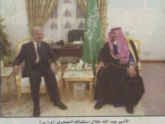
الأمير عبد الله خلال استقباله الجعفري