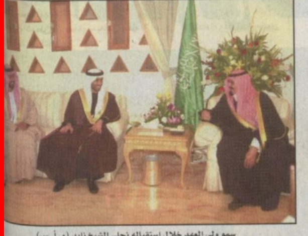
سمو ولي العهد خلال استقباله نجلي الشيخ زايد