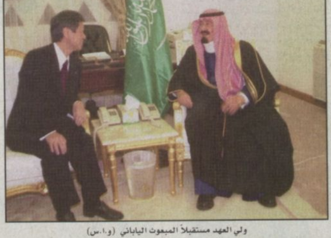
ولي العهد مستقبلاً المبعوث الياباني (و.ا.س)