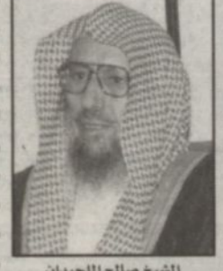
الشيخ صالح اللحيدان

مكة المكرمة - عطا الله العصيمي: يلقي رئيس مجلس القضاء الأعلى فضيلة الشيخ صالح بن محمد اللحيدان دروسه اليومية لجموع المسلمين بالمسجد الحرام والتي اعتاد إقامها في كل يوم من أيام الشهر الكريم منذ عدة سنوات. وسوف تكون مواعيد الدروس لهذا العام