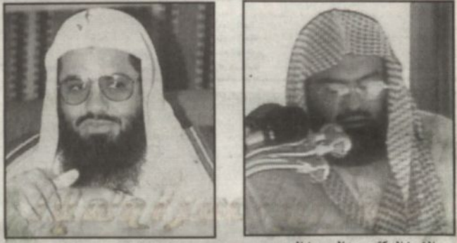
الشيخ الدكتور عبدالرحمن السديس، الشيخ الدكتور سعود الشريم