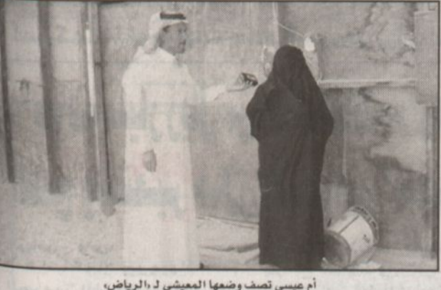
أم عيسى تصف وضعها المعيشي لـ «الرياض»