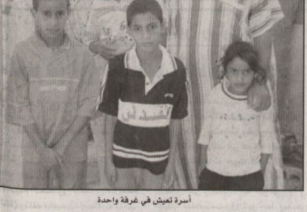
أسرة تعيش في غرفة واحدة