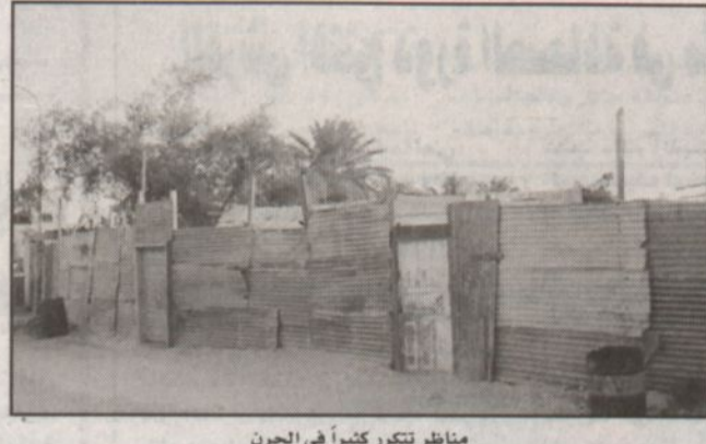
مناظر تكرر كثيراً في الجرن