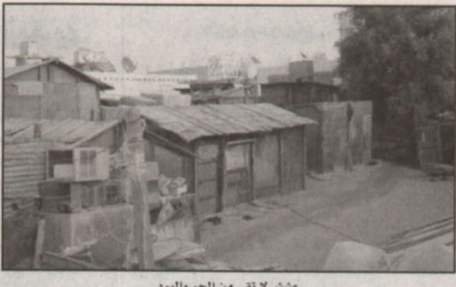
عشش لا تقي من الحر والبرد