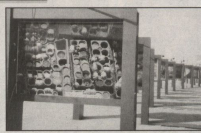
معرض الأرض والسماة العالمي جديد الجنادرية