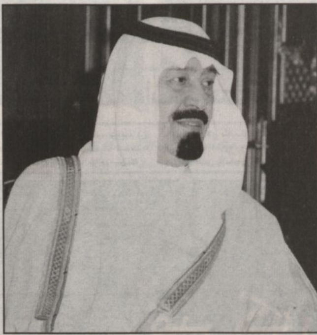
الأمير متعب بن عبدالله

نيابة عن خادم الحرمين الشريفين الملك فهد بن عبدالعزيز يرعى سمو صاحب السمو الملكي الأمير عبدالله بن عبدالعزيز ولي العهد نائب رئيس مجلس الوزراء ورئيس الحرس الوطني عصر اليوم الأريضاء انطلاقاً فعاليات الجنادرية ١٩ حيث يرعى عصر سباق الهجن السنوي في شوطه الأول والذي يبدأ بالسلام الملكي والقرآن الكريم ثم بدء السباق وبعد ذلك يقوم سموه بتسليم الفائزين في المراكز من ١ - ٥٠ الجوائز حيث يحصل الأول والثاني على سيارة والبقية على مبالغ مالية وأغلاف. وبعد سباق الهجن يتناول سموه والمدعوون العشاء ثم التوجه لافتتاح المقر الجديد لوزارة الدفاع والطيران ممثلة بأرفع القوات المسلحة جميعها وبعد ذلك يفتتح سموه مقر قرية منطقة جازان وبعد صلاة العشاء يبدأ الحفل الخطابي والذي يقام في صالة العروض الرئيسية بالقرآن الكريم ثم كلمة من سموه الوطني الشيخ محمد بن ناصر العبودي ومن ثم يبدأ أوبريت «عرين الأسد» والذي يستمر لمدة ٥٠ دقيقة. صحب بذلك لـ «الرياض» وكيل الحرس الوطني الدكتور عبدالرحمن بن سعيد السبيت وأضاف أن سموه يرعى حفل العرش السعودية السنوي الأريضاء ١٩/١ والصالة الرياضية بمشيلة الله. وأضاف أن