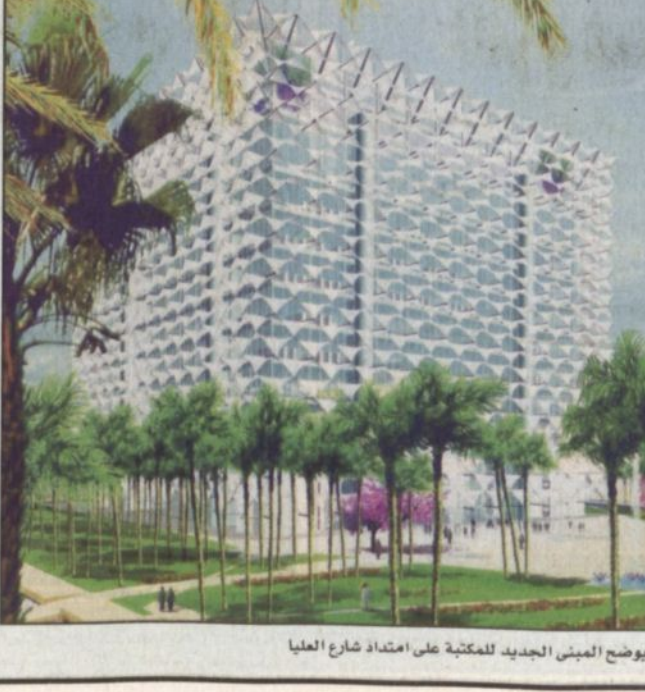
رسم يوضح المبنى الجديد للمكتبة على امتداد شارع العليا