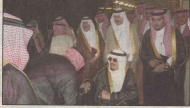
وصول خادم الحرمين الشريفين جدة

جدة - واس: وصل بحفظ الله وورعائه خادم الحرمين الشريفين الملك فهد بن عبدالعزيز آل سعود في وقت لاحق مساء أمس.