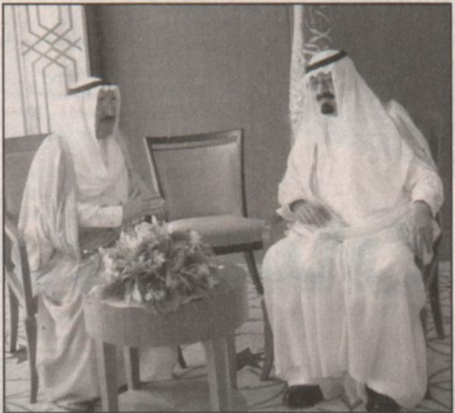
ولي العهد والشعب صباح خلال لقائهما الجانبي على هامش أعمال القمة