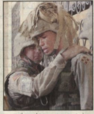
جندي أمريكي يواسي ميمله بعد مقتل اثنين الذين أقيم لصدقه الذي قتل بمدينة تكريت الأسوق الماضي

بغداد - أ.ف.ب، رويترز، أعلن متحدث باسم قوات الاحتلال مقتل أربعة جنود أمريكيين وإصابة أربعة آخرين في هجوميين منفصلين في كربلاء وبغداد. وقال المتحدث إن الهجوم في كربلاء أسفر أيضاً عن مقتل جنديين من الشرطة العراقية وإصابة خمسة آخرين. وكان المهاجمون تمركزوا فوق أسطح عدد من المنازل بانتظار مرور دورية للشرطة العراقية يرافقها عدد من عناصر الشرطة العسكرية الأمريكية بالقرب من مسجد العباس قبل أن ينفذوا هجومهم. وفي بغداد أعلنت القوات الأمريكية مقتل جندي أمريكي وإصابة اثنين آخرين في إنفجار قنبلة وقع صباح أمس الجمعة في أحد ضواحي العاصمة. إلى ذلك أعلنت وزارة الدفاع البريطانية أن مديناً عراقياً قتل أول من أمس على أيدي القوات البريطانية بعد أن تعرضوا لإطلاق نار عند إحدى محطات المينزين في البصرة بعد خلاف نشأ فيها بين مجموعتين عراقيتين