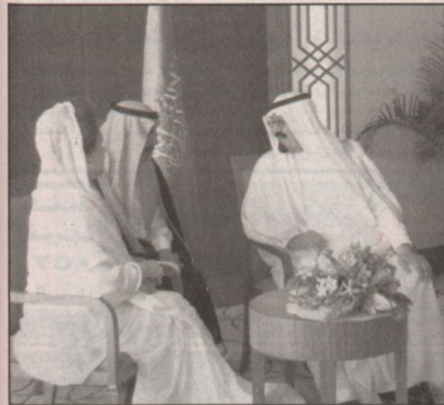
حديث جبر المترجم بين الأمير عبدالله ورئيس وزراء بنغلاديش (و.أ.س)