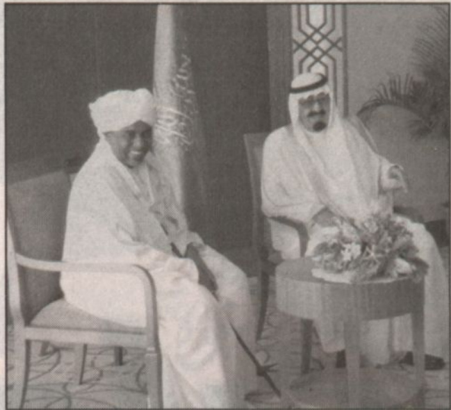
ولي العهد يستقبل الرئيس السوداني