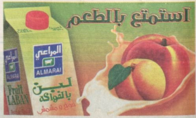
السبت ٢٢ محرم ١٤٢٤ هـ - ١٨ أكتوبر ٢٠٠٣ م - العدد ١٢٨٩٩ - السنة الأربعون