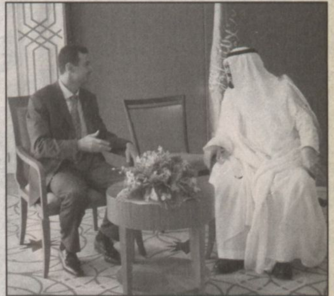
اجتماع الأمير عبدالله وشار الأسد