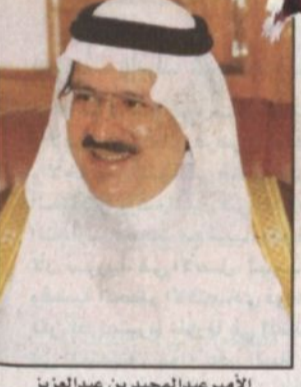
الأميرعبدالمجيد بن عبدالعزيز

تشؤون الطيران المدني وصاحب السمو الأمير فيصل بن عبدالله بن محمد آل سعود مساعد رئيس الاستخبارات العامة وصاحب السمو الملكي الأمير محمد بن نواف بن عبدالعزيز سفير خادم الحرمين الشريفين لدى إيطاليا وصاحب السمو الملكي الأمير خالد بن عبدالله بن عبدالعزيز وصاحب السمو الأمير الدكتور خالد بن فيصل بن تركي آل سعود وكيل الحرس الوطني المكلف بالقطاع الغربي وصاحب السمو الملكي الأمير مشعل بن ماجد بن عبدالعزيز محافظ جدة وصاحب السمو الملكي الأمير عبدالعزيز بن ماجد بن عبدالعزيز نائب أمير منطقة القصيم وأصحاب السمو الملكي الأمراء. كما كان في وداع سموه أصحاب المعالي الوزراء وكبار المسؤولين من مدنيين وعسكريين. وقد غادر صاحب السمو الملكي الأمير عبدالله بن عبدالعزيز ولي العهد ونائب رئيس مجلس