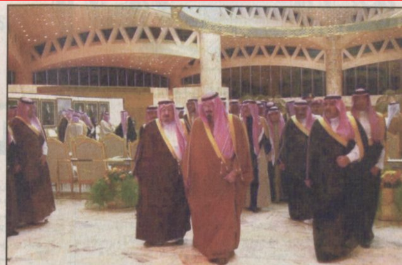
وصول سمو ولي العهد الرياض (و.أ.س.)