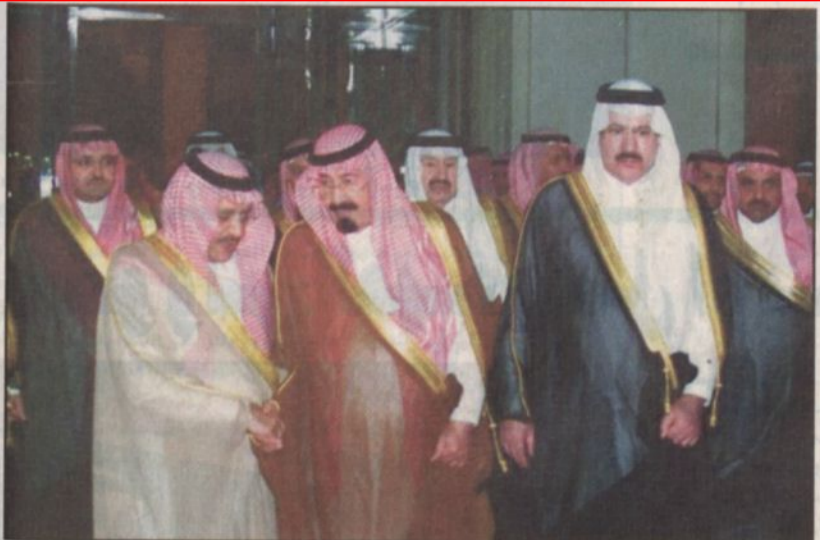
مغادرة سموه جدة

مكة المكرمة - واس: ■ استقبل صاحب السمو الملكي الأمير سلطان بن عبدالعزيز النائب الثاني لرئيس مجلس الوزراء وزير الدفاع والطيران والمفتش العام مساء أمس بقصر سموه بحي العزيزية في مكة المكرمة دولة رئيس مجلس الوزراء بجمهورية لبنان الشقيقة رفيق الحريري وتم خلال اللقاء مناقشة العديد من