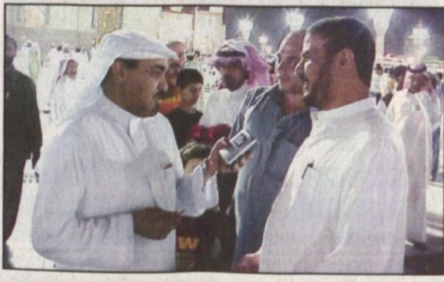
اخذ الزوار يتحدث للزميل الاحمدي

الشريفيين لابتحات الحج اعداد المصلين الذين ادوا صلاة التراويح بالمسجد الحرام ليلة أمس - الساب والعشرين من شهر رمضان - بحوالي مليون مصل، وقال المعهد في بيانه ان هذا العدد يقل عن اعداد المصلين في العام المنصرم بنسبة 15 ٪ تقريبا، داخل المسجد الحرام او من ساحاته، لقياس اعداد المصلين وأوضح ان عدة عناصر بيدروم المسجد الحرام كانت شبه خالية، كما ان امتداد الصفوف في النواحي الشرقية من المسجد كانت اقل من العام الماضي، إضافة الى وجود مساحات شاغرة في المصلين الملحة والمسجد الحرام كصلى مكة مكة للأشياء والتعمير. وأوضح التفسير ان اقتراض المصلين لساحات والطرق قبل امتلاء المسجد يسبب اصافة للفاصدين وذلك بسبب الرغبة في أداء الصلاة في مكان قريب ذي تهوية جيدة، وعزا البيان وجود مساحات شاغرة بالبيدروم الى ضعف النظام الارشادي لمداخل البيدروم سواء من داخل المسجد الحرام او من ساحاته، إضافة الى سوء تنظيم الممرات وضيقتها قبل اقامة الصلاة، كما ان المادة المستخدمة في تحديد الممرات تعمل على اعاقبة المشاة لكثرة ثنياتها وعدم تثبيتها بشكل جيد، وتؤدي الى عرقلة عربات كبار السن والمعاقين، وازاد البيان جهود الرئاسة العامة لشؤون المسجد الحرام في تكتيف الرقابة على البوابات والمداخل، إضافة الى