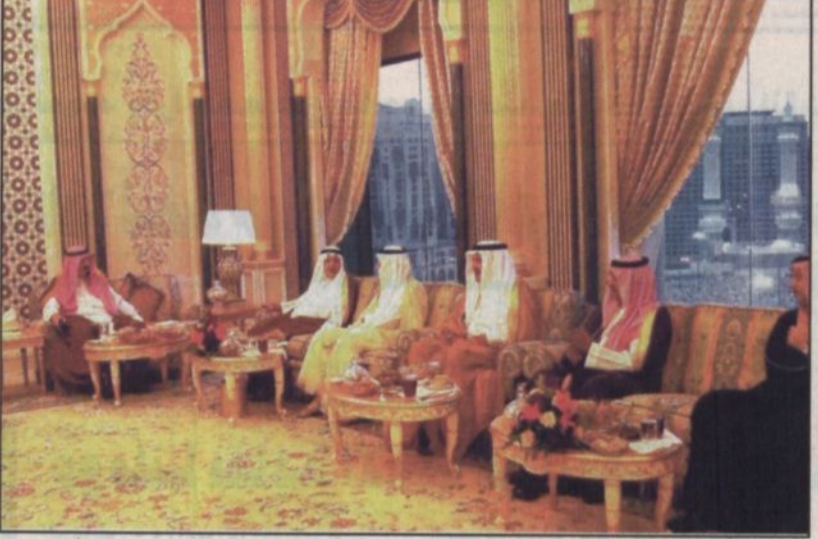
الأمير عبدالله يستقبل أصحاب السمو الملكي الأمراء وعدد من المسؤولين في قصر الصفا بمكة

الرياض، جدة - و.أ.س: ■ وصل بحفظ الله وعايته صاحب السمو الملكي الأمير عبدالله بن عبدالعزيز ولي العهد ونائب رئيس مجلس الوزراء ورئيس الحرس الوطني إلى الرياض في وقت لاحق مساء أمس. وكان في استقبال سموه لدى وصوله مطار الملك خالد الدولي صاحب السمو الملكي الأمير بدر بن عبدالعزيز نائب رئيس الحرس الوطني وصاحب السمو الأمير سعود بن خالد وصاحب السمو الملكي الأمير سلطان بن عبدالعزيز نائب أمير منطقة الرياض وأصحاب السمو الملكي الأمراء. كما كان في استقبال سمو ولي العهد معالي نائب رئيس الحرس الوطني المساعد الشيخ عبدالعزيز بن عبدالمحسن التويجري وكبار المسؤولين من مدنيين وعسكريين وكلاء الحرس الوطني وجمع من المواطنين. ووصل في معية سمو ولي العهد صاحب السمو الملكي الأمير عبدالله بن عبدالعزيز وصاحب السمو الملكي الأمير هذلول بن عبدالعزيز وصاحب السمو الأمير تركي بن عبدالله بن محمد المستشار في ديوان سمو ولي العهد وصاحب السمو الأمير الدكتور بندر بن سلمان آل سعود المستشار في ديوان سمو ولي العهد وصاحب السمو الملكي الرائد طيار تركي بن عبدالله بن عبدالعزيز وصاحب السمو الملكي الأمير سعود بن عبدالله بن عبدالعزيز وصاحب السمو الملكي الأمير منصور بن عبدالله بن عبدالعزيز وصاحب السمو الملكي الأمير محمد بن عبدالله بن عبدالعزيز. كما وصل في معية سموه معالي رئيس ديوان سمو ولي العهد الأستاذ ناصر بن حمد الراجحي ومعالي المستشار في ديوان سمو ولي العهد الأستاذ تركي الفيصل سفير خادم الحرمين الشريفين لدى بريطانيا وصاحب السمو الأمير فهد بن عبدالله آل سعود مساعد وزير الدفاع والطيران