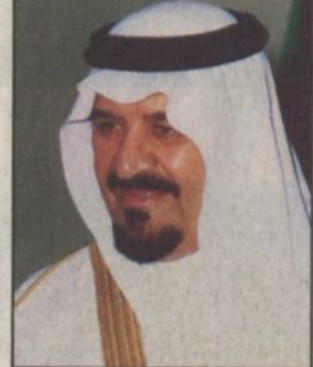
الأمير سلطان بن عبدالعزيز

جدة، تبوك - صالح الرويس، عودة العلو، علي القرني: ■ يقوم صاحب السمو الملكي الأمير سلطان بن عبدالعزيز النائب الثاني لرئيس مجلس الوزراء وزير الدفاع والطيران والمفتش العام بدءاً من يوم الأربعاء الثاني من أيام عيد الفطر المبارك وحتى يوم الخميس العاشر من شهر شوال بزيارة تفقدية ومعادية لمنسوبي القوات المسلحة في كل من المنطقة الشمالية الغربية والشرقية والشمالية بمناسبة حلول عيد الفطر المبارك. وينقل سمو النائب الثاني لمنسوبي القوات المسلحة تهاني خادم الحرمين الشريفين الملك فهد بن عبدالعزيز آل سعود وسمو ولي عهده الأمين بمناسبة عيد الفطر المبارك. وسيقوم سموه الكريم خلال الزيارات التفقدية بافتتاح العديد من المشروعات، ففي تبوك سيقيم سموه بافتتاح قاعة الأمير سلطان للاحتفالات وتشريف حفل الغداء الذي تقيمه قيادة المنطقة الشمالية الغربية تكريماً لسموه