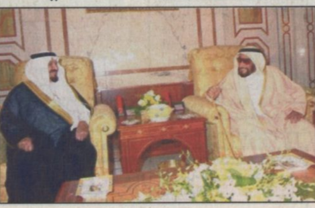
الشيخ زايد يستقبل الأمير سلطان

الأمير سلطان بن عبدالعزيز قد غادر المنطقة الشمالية أمس. وكان في وداع سموه بالصالة الملكية بمطار مدينة الملك خالد العسكرية صاحب السمو الملكي الأمير محمد بن فهد بن عبدالعزيز أمير المنطقة الشرقية وصاحب السمو الملكي الأمير خالد بن سلطان بن عبدالعزيز مساعد وزير الدفاع والطيران والمفتش العام للشؤون العسكرية وأصحاب السمو الملكي الأمراء. كما كان في وداع سموه مدير عام مكتب وزير الدفاع والطيران والمفتش العام الفريق علي الخليفة ومدير عام الإدارة العامة للأشغال العسكرية اللواء سعد الريمح وقائد المنطقة الشمالية اللواء ركن عبود الحربي ومساعد حذر الباطن حمد بن جبرين وقائد قوة درع الجزيرة وضباط القوات المسلحة وقوة درع الجزيرة بالمنطقة وعدد من كبار المسؤولين.