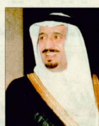
الأمير سلمان بن عبدالعزيز

الرياض - واس: استقبل صاحب السمو الملكي الأمير سلمان بن عبدالعزيز أمير منطقة الرياض بمكتب سموه بقصر الحكم أمس معالي وزير الطرق والشؤون الإسلامية في سريلانكا عبدالحميد محمد فوزي والوفد المرافق له. وجرى خلال المقابلة تبادل الاحاديث الودية حول عدد من الموضوعات ذات الاهتمام المشترك بين البلدين. البقية ص 33