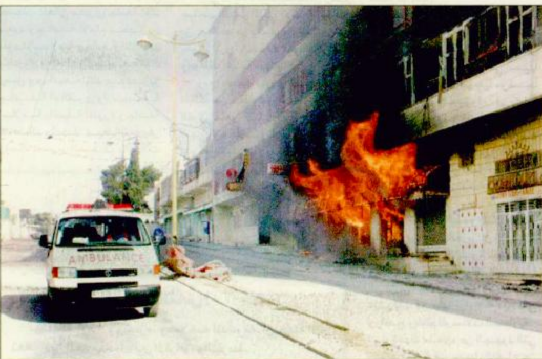
القوات الإسرائيلية تحرق فنادق ومنازل بيت لحم وسيارات الإسعاف عاجزة عن نقل الجرحى

غزة - القدس - واشنطن: استشهد 11 شخصاً من قوات الأمن الوطني والمواطنين وسقط العشرات جرحى في مجزرة إسرائيلية ضد قرية بيت ريما شمال غرب رام الله لم تعرف حصيلة الضحايا حتى الآن حيث منعت السلطات الإسرائيلية أطقم الصليب الأحمر من دخول بلدة بيت ريما شمال غربي رام الله حسبما أعلنته مصادر فلسطينية أمس. وأجبرت سلطات الاحتلال أطقم الصليب الأحمر على مغادرة مدخل بيت ريما بعد إبلاغها من قبل جيش الاحتلال بضرورة مغادرة المنطقة فوراً خاصة وأن هناك تعليمات من تل أبيب بعدم البقاء في المنطقة. وقامت السلطات الإسرائيلية بمنع الصحفيين من الوصول إلى بيت ريما في محاولة لطمس الجريمة البشعة التي ارتكبتها إسرائيل بحق الفلسطينيين وحملت السلطة الفلسطينية مسؤولية المجزرة الفلسطينية حيث استشهد 11 فلسطينياً. وعلى نفس الصعيد وسعت إسرائيل من عدوانها على الشعب الفلسطيني فبعد بيت ريما تعرضت مناطق عدة من مدينة بيت لحم وحمص وعابدة والعرزة إلى القصف العنيف بالرشاشات الثقيلة وقذائف الدفعية. وأشارت مصادر فلسطينية أن القصف طال باب الزقاق والسينما ومحيط مسجد بلال بن رباح وشارع المهدي ومحيط