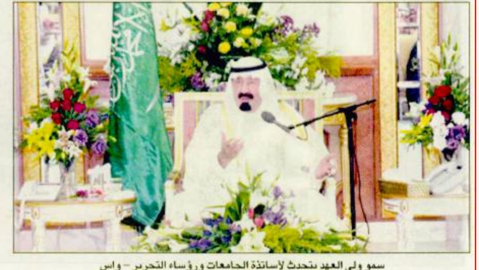
سمو ولي العهد يتحدث لاساتذة الجامعات ورؤساء التحرير - واس

الرياض - واس: أكد صاحب السمو الملكي الأمير عبدالله بن عبدالعزيز ولي العهد نائب رئيس مجلس الوزراء ورئيس الحرس الوطني بأن ما تتعرض له المملكة من حملة شرسية من الإعلام الغربي ماثق حقد دفين على النهج الإسلامي الواضح والتزام المملكة بكتاب الله وسنة نبيه مؤكداً أن الحفاظ على الدين والوطن أمر لا مسامحة عليه. وتفرد سمو ولي العهد لدى استقباله أمس معالي وزير التعليم العالي الدكتور خالد بن محمد العنقري ومعالي وزير الإعلام الدكتور فؤاد بن عبدالسلام الفارسي وأصحاب المعالي مدير جامعة الملك سعود وجامعة الإمام محمد بن سعود الإسلامية وجامعة الملك فهد للبترول والمعادن وجامعة الملك فيصل وجامعة الملك عبدالعزيز وجامعة أم القرى والجامعة الإسلامية بالمدينة المنورة وجامعة الملك خالد وأعضاء هيئة التدريس