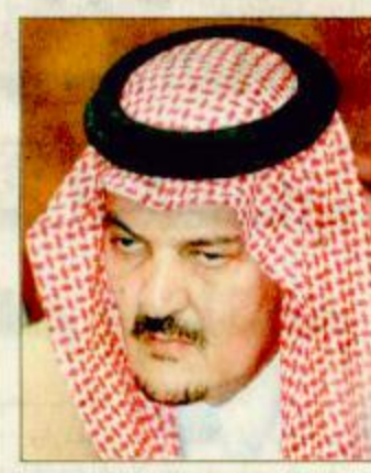
الأمير سعود الفيصل

الرياض - د ب أ: قال مصدر دبلوماسي في وزارة الخارجية السعودية - إن وزير الخارجية الأمير سعود الفيصل سيقيم اليوم «الخميس» زيارة في غاية الأهمية، إلى باكستان تستغرق يوماً واحداً. وأضاف المصدر الذي فضل عدم الكشف عن هويته أن الأمير سعود الفيصل «سيلتقي مع الرئيس الباكستاني برفيز مشرف ونظيره الباكستاني عبد الستار». البقية ص 33