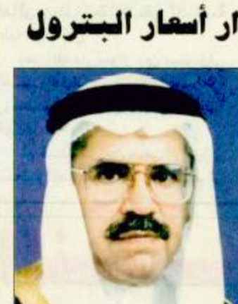
المهندس علي النعيمي

دبي - رويترز: قالت وكالة أنباء الإمارات أمس الأربعاء إن وزراء نفط المملكة العربية السعودية وسلطنة عمان ودولة الإمارات سيركزون في محادثاتهم على سبل تحقيق استقرار سوق النفط العالمية عندما يجتمعون يوم السبت في أبوظبي. ونقلت الوكالة عن مسؤول بوزارة النفط لم تذكر اسمه قوله - إن المحادثات ستستمر عدة ساعات وستركز على التطورات في سوق النفط العالمية والإجراءات التي يمكن اتخاذها لتحقيق الاستقرار. ومن المقرر أن يلتقي معالي وزير البترول والثروة المعدنية المهندس علي النعيمي ونظيره العماني محمد بن حمد الرميح بنظيرهما الإماراتي عبيد بن سيف الفارسي صباح السبت المقبل، وعمان ليست عضواً في أوبك. ويأتي الاجتماع في وقت تكثف فيه أوبك مساعيها لحشد تأييد المنتجين من خارج المنظمة من أجل تعزيز أسعار النفط التي هبطت نحو 25 بالمئة منذ هجمات الشهر الماضي في الولايات المتحدة.