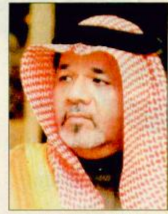
وزير الإعلام د. الفارسي

المنامة - جمال الباقوت - واس: أكد وزراء الإعلام بدول مجلس التعاون لدول الخليج العربية على ما سبق أن وجه به قيادة دول المجلس حيال التصدي للأهاب بكل أشكاله ضمن المساعي الدولية في هذا الشأن. كما أكد الوزراء في ختام اجتماعهم الثاني عشر في المنامة أمس على ضرورة التحرك الإعلامي داخلياً وخارجياً لمواجهة الحملات الإعلامية التي تسعى إلى تشويه صورة الإنسان العربي والمسلم. وشددوا على أهمية تكثيف التحرك الإعلامي الخارجي لدول المجلس بما يتناسب مع المستجدات