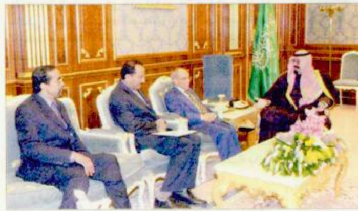
سموه مستقبلاً الأيراني