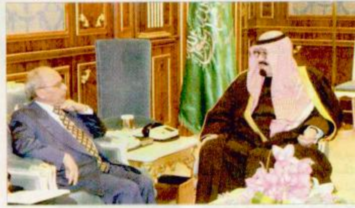
الرياض - واس:

سمو ولي العهد الأمير عبد العزيز بن عبد الرحمن آل سعود، رئيس مجلس الوزراء ورئيس الحرس الوطني بالديوان الملكي في قصر اليمامة بالرياض اليوم، ساحة مفتي عام المملكة ورئيس هيئة كبار العلماء وإدارة البحوث العلمية والإفتاء الشيخ عبد العزيز بن عبد الله آل الشيخ وفضيلة صالح بن محمد الليحان وأصحاب الفضيلة العلماء والمشايخ، وحضر الاستقبال صاحب السمو الملكي الأمير بندر بن خالد بن عبد العزيز وصاحب السمو الملكي الأمير خالد بن سلطان بن عبد العزيز مساعد وزير الدفاع والطيران والمفتش العام للشؤون العسكرية وصاحب السمو الأمير نايف بن عبد الله بن عبد الرحمن وصاحب السمو الأمير الدكتور بندر بن سلمان بن محمد آل سعود المستشار في ديوان سمو ولي العهد وصاحب السمو الملكي الأمير عبد العزيز بن سطاتم بن عبد العزيز ومعالى المستشار في ديوان سمو ولي العهد الأستاذ عبد المحسن بن عبد العزيز التويجري.