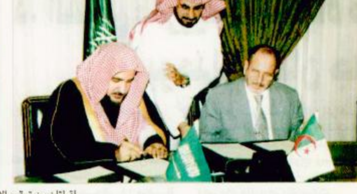
التمتان من توقيع الاتفاقية والاستقبال

بالمطبوعات الإسلامية من كتب وأبحاث ودراسات، الاستفادة من خبرة مجمع الملك فهد لطباعة المصحف الشريف في المدينة المنورة، وتبادل الخبرات والمعلومات في أساليب تنظيم الأوقاف، وتمنياتها، واستثمارها إلى جانب الاستفادة من خبرة المملكة في مجال جمع الزكاة وتوزيعها. وحضر توقيع الاتفاقية الوفد المرافق لمعالي الوزير الجزائري، وسفير الجزائر لدى المملكة عبدالكريم غريب، وممثل الوزارة للشؤون الإسلامية المكلف الدكتور توفيق بن عبدالعزيز السديري، والمدير العام لإدارة العامة للعلاقات العامة والإعلام سلمان بن محمد العمري. وعقب توقيع الاتفاقية، أكد معالي الوزير الشيخ صالح بن عبدالعزيز آل الشيخ - في تصريح لوسائل الإعلام - أن اتفاقية التعاون الثقافي التي تم التوقيع عليها بين الوزيرين تترجم مدى عمق العلاقات والتعاون القائمة بين البلدين الشقيقين في ظل القيادتين الحكيمتين خادم الحرمين الشريفين الملك فهد بن عبدالعزيز آل سعود - حفظه الله - وفخامة رئيس