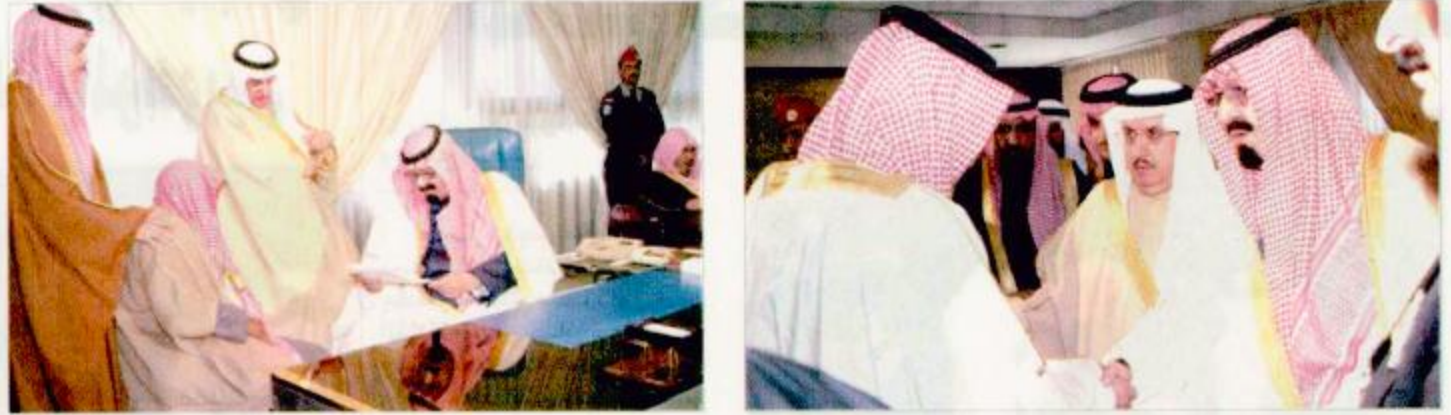
الأمير عبدالله لدى استقباله المواطنين