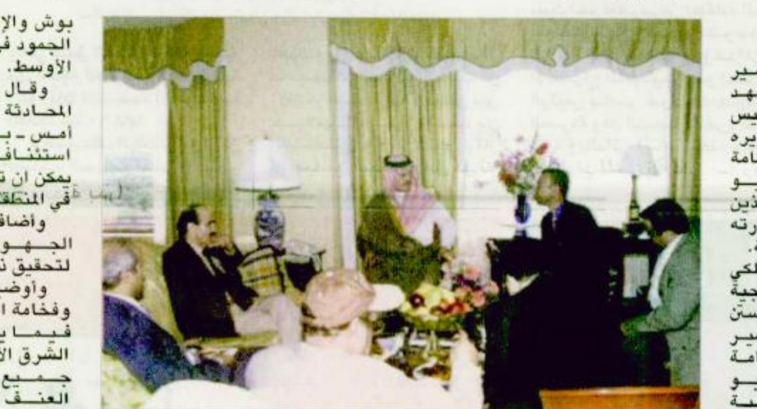
الأمير سعود الفيصل يعقد مؤتمراً صحفياً في هيوستن

بوش والإدارة الأمريكية لكسر الجمود في الأزمة الحالية في الشرق الأوسط. وقال إن الزعيمين اعتبراً خلال المحادثة الهاتفة ما حصل اليوم - أمس - بأنه خطوة في طريق استئناف المفاوضات السياسية التي يمكن أن تقود إلى سلام عادل وشامل في المنطقة. وأضاف أنهما وعدا باستمرار بذل الجهود والتعاون بين البلدين لتحقيق ذلك الهدف. وأوضح أن سمو الأمير عبدالله وفخامة الرئيس جورج بوش أعربا فيمَا يتعلق بالوضع الحالي في الشرق الأوسط عن أملهما أن تقوم جميع الأطراف المعنية بنبذ العنف كطريقة لتحقيق الأهداف السياسية. وقال سموه إن الانفراج الذي حصل اليوم يشكل فرصة للتقدم إلى الأمام ويده المفاوضات التي يمكن أن تؤدي إلى سلام دائم معرباً عن أمه أن تفهم جميع الأطراف المعنية حكمة