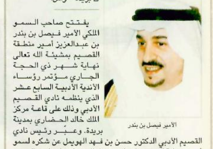
الأمير فيصل بن بندر

الافتتاحية الدكتور حسن بن فهد الهويمل عن شركه لسمو أمير منطقة القصيم لبرعايته حفل الافتتاح وصاحب السمو الملكي الأمير سلطان بن فهد الرئيس العام لرعاية الشباب لموافقته على استضافة النادي للمؤتمر. وأوضح بأن فعاليات المؤتمر الذي تم تشكيل لجانه العاملة ستستمر حتى الرابع من شهر محرم القادم بمشيئة الله، حيث سينفذ على هامش المؤتمر ندوة علمية كبرى بعنوان الرواية بوصفها أقوى حضوراً. كما سيعقد خلال المؤتمر خمس جلسات للمؤتمر وأمسيتان شعريتان يشترك في كل أمسية ستة شعراء. تمنى الدكتور الهويمل للمشاركين والباحثين في المؤتمر التوفيق والنجاح.