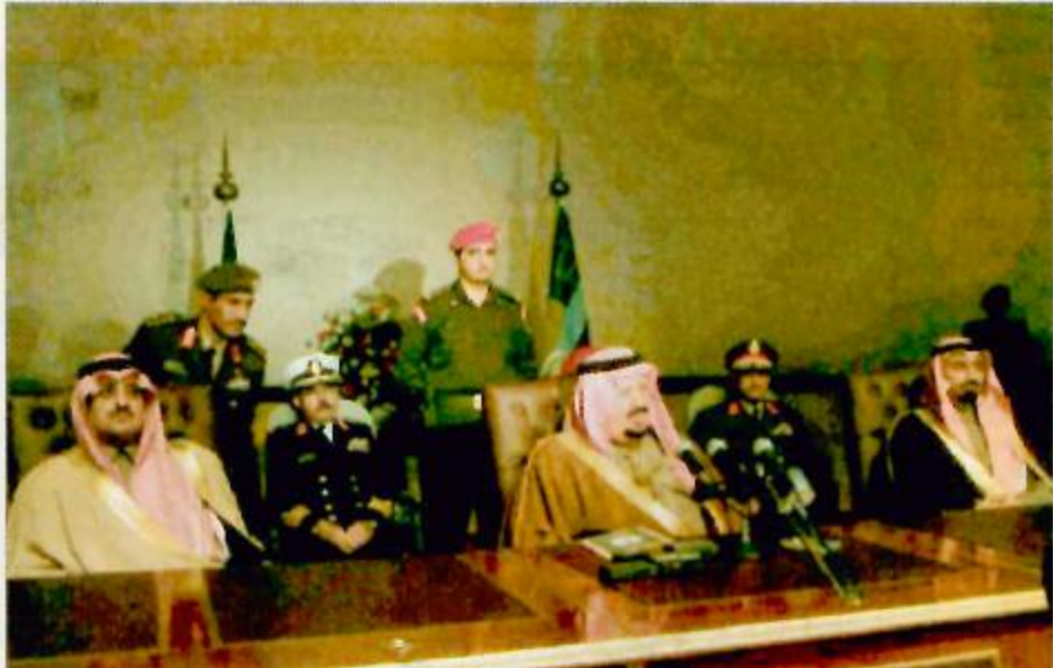
الأمير عبد الرحمن خلال رعايته للحفل