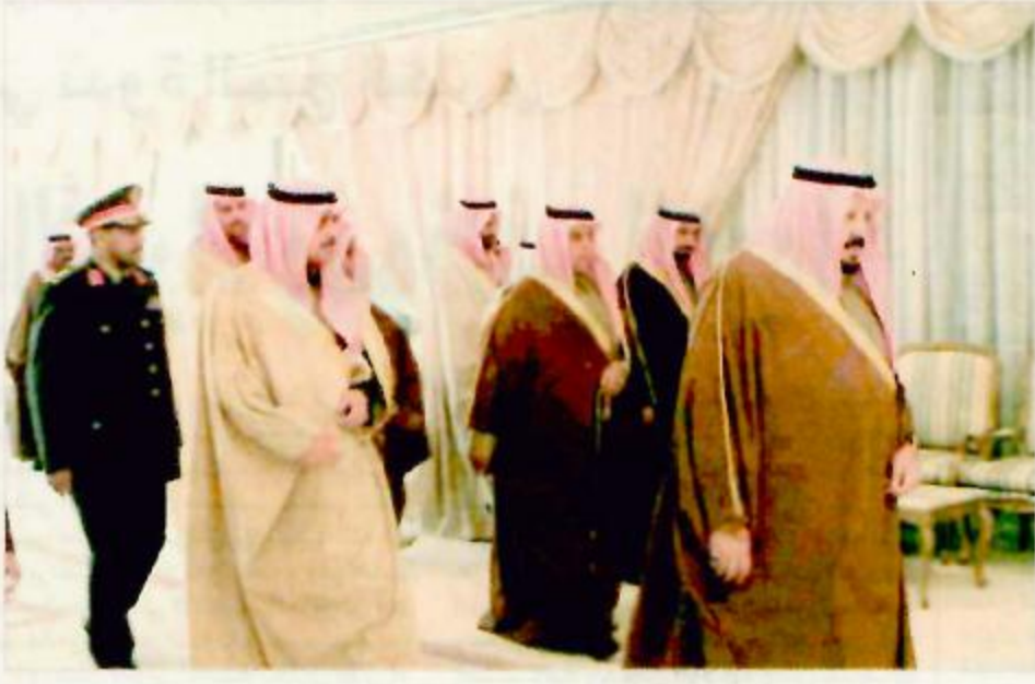
سموه يوصل المنطقة الشمالية الغربية