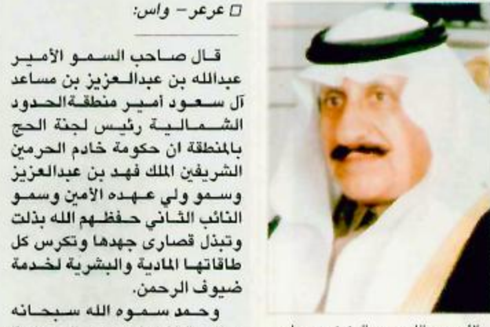
الأمير عبدالله بن عبدالعزيز بن مساعد

أداء مناسكهم بكل يسر وسهولة تكوهم عناية المولى جل وعلا. وأشار سمو أمير منطقة الحدود الشمالية في تصريح لوكالة الأنباء السعودية إلى الميابة والإشراف المباشر من صاحب السمو الملكي الأمير تاييف بن عبدالعزيز وزير الداخلية رئيس لجنة الحج العليا الذي سخر وقته وجهده لخدمة ضيوف الرحمن داعياً سموه الله أن يجعل الأعمال المباركة والجهود المخلصة في ميزان حسنات خادم الحرمين الشريفين وسمو ولي عهده الأمين وسمو النائب الثاني حفظهم الله وإن يتقبل من حجاج بيته العتيق حجهم وإن يعودوا إلى أوطانهم سالمين غانمين.