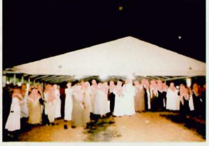
لقطتان من المخيم الترفيهي

كما استضاف المخيم الترفيهي في لقاء مفتوح مع المحقق النائب بدر عايض والذي تحدث بكل صراحة عن تجربته الماضية وخطرها على المجتمع سارداً الكثير من القصص المؤثرة والتي تؤكد خطورة هذه الظاهرة على شبابنا ثم توالى الفقرات المعدة لليلة البارحة والتي تفاعل معها الحضور والذين تجاوز السبعة آلاف من