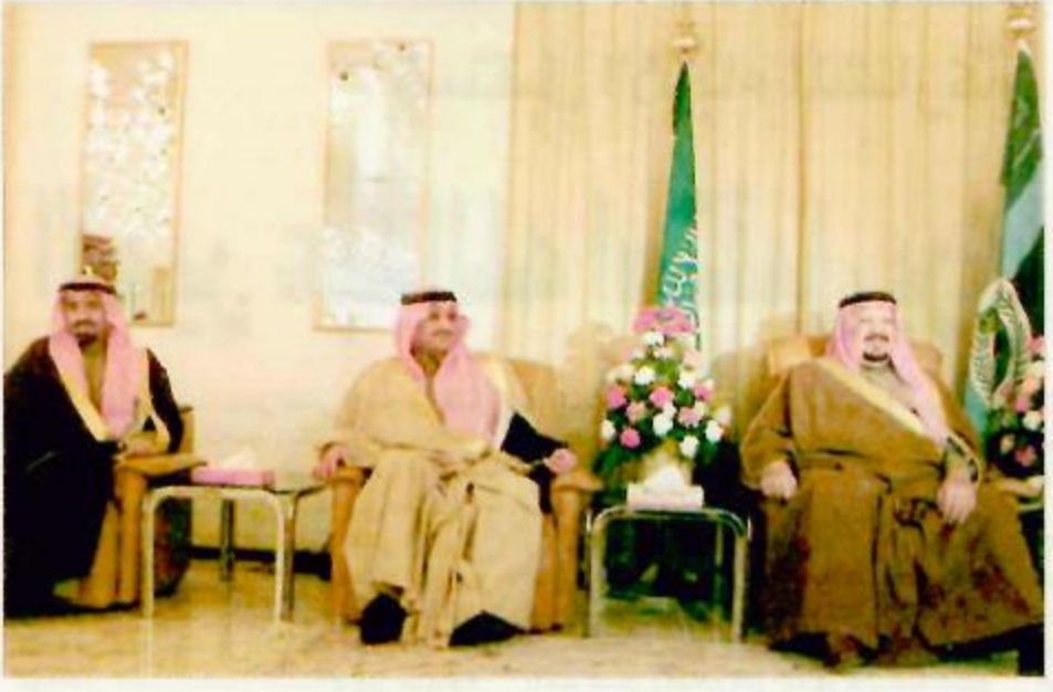
سموه يشرف حفل الغداء الذي اقامته المنطقة الشمالية الغربية