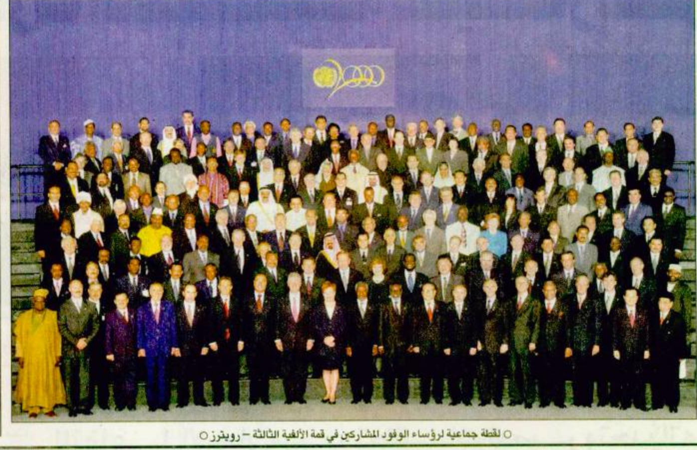
لغة جماعية لرؤساء الوفود المشاركين في قمة الألفية الثالثة

سمو النائب الثاني يحيي بأمير البحرين مكتب وزير الدفاع والطيران والمفتش العام الفريق علي بن محمد الطيفه وقائد المنطقة الغربية بالنيابة قائد الاسطول الغربي اللواء البحري الركن محمد بن عبدالله العجلان وعدد من كبار ضباط القوات المسلحة بالمنطقة الغربية. البقية - ص ٣٣