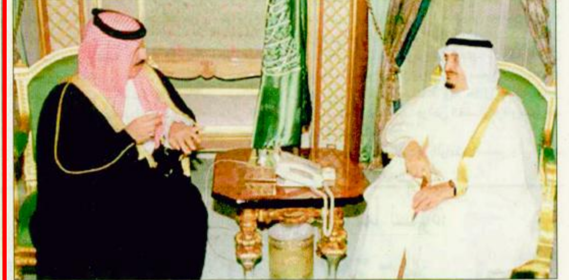
خادم الحرمين الشريفين لدى استقباله أمير البحرين