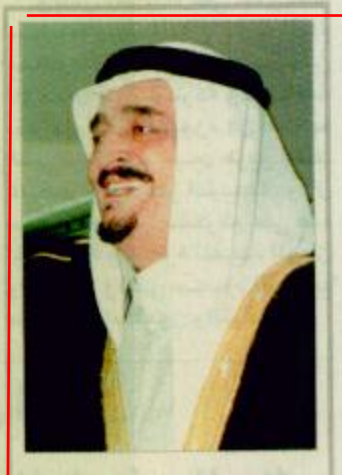
الملك يهنئ رئيسي بنجلاديش وناميبيا

كتب - خالد المشاري: يتشرف شباب الوطن ورياضيوه مساء اليوم بقاءه صاحب السمو الملكي الأمير عبدالله بن عبدالعزيز آل سعود ولي العهد نائب رئيس مجلس الوزراء ورئيس الحرس الوطني، حيث يرعى المباراة النهائية على كأس مسابقة ولي العهد التي ستجمع الأهلي والاتحاد والتي ستقام على استاد الملك فهد الدولي بالرياض.. وستتسلم الفريق الفائز كأس سموه إضافة للميداليات الذهبية، بينما سيحصل الفريق الثاني على التشراف بلعب هذا اللقاء الكبير، المهدييات الفضية.. وكان الفريقان قد استطاعا الوصول إلى التشراف بلعب هذا اللقاء الكبير، بعدما تمكنوا من تخطي أدوار المسابقة التي شارك بها جميع اندية المملكة (١٥٣) نادياً. وتابع ملحق كس ولي العهد (٢٧/٣٠٠٠)