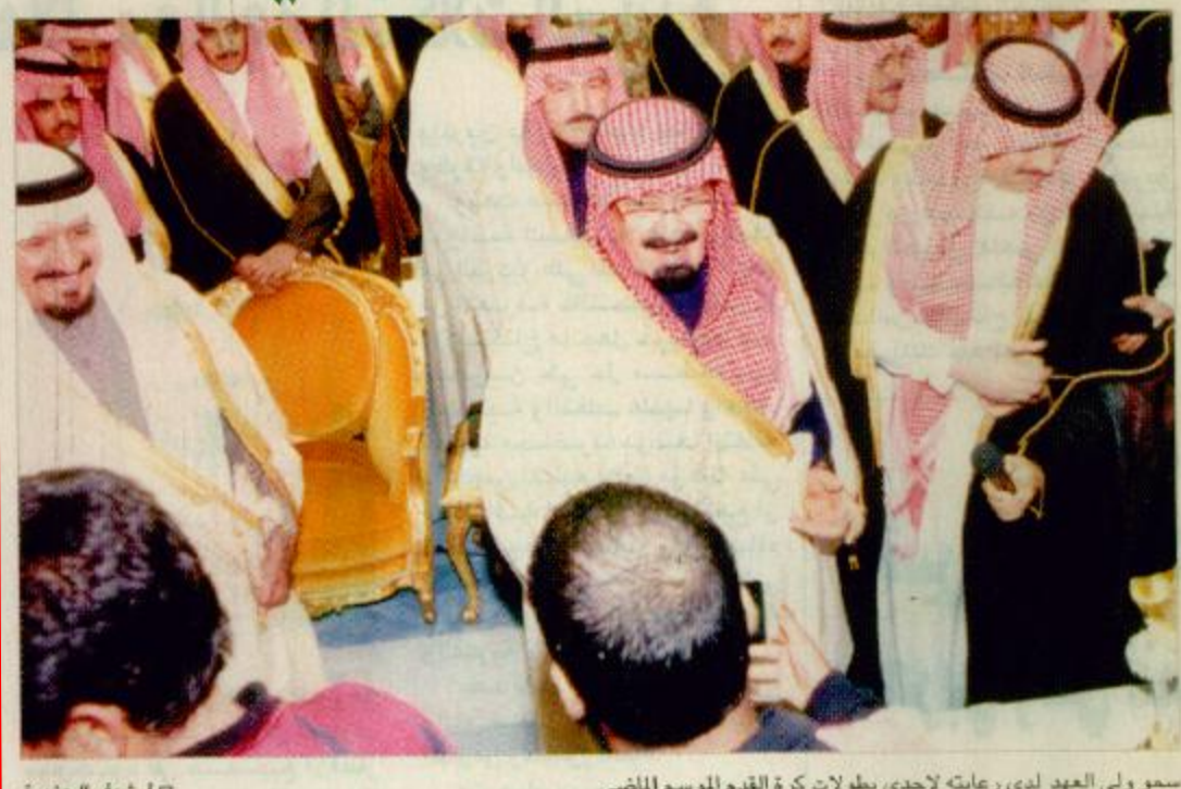
سمو ولي العهد لدى رعايته لإحدى بطولات كرة القدم الموسم المنشي

كتب - خالد المشاري: يتشرف شباب الوطن ورياضيوه مساء اليوم بقاءه صاحب السمو الملكي الأمير عبدالله بن عبدالعزيز آل سعود ولي العهد نائب رئيس مجلس الوزراء ورئيس الحرس الوطني، حيث يرعى المباراة النهائية على كأس مسابقة ولي العهد التي ستجمع الأهلي والاتحاد والتي ستقام على استاد الملك فهد الدولي بالرياض.. وستتسلم الفريق الفائز كأس سموه إضافة للميداليات الذهبية، بينما سيحصل الفريق الثاني على التشراف بلعب هذا اللقاء الكبير، المهدييات الفضية.. وكان الفريقان قد استطاعا الوصول إلى التشراف بلعب هذا اللقاء الكبير، بعدما تمكنوا من تخطي أدوار المسابقة التي شارك بها جميع اندية المملكة (١٥٣) نادياً. وتابع ملحق كس ولي العهد (٢٧/٣٠٠٠)