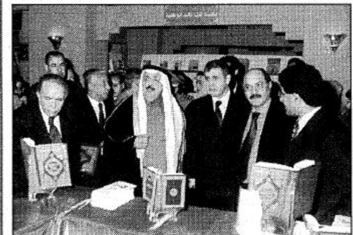
د. العنقري والي فاس في احد المعارض

قام معالي وزير العمل والشؤون الاجتماعية الدكتور علي بن ابراهيم النملة مغرب امس الجمعة بزيارة لدار التربية الاجتماعية بالرياض وذلك لشاركته ابنه طلاب الدار طعام الإفطار بمناسبة شهر رمضان المبارك حيث كان في استقبال معاليه مدير دار التربية الاجتماعية الأستاذ عبد البقيع ومنسوبي وطلاب الدار. حيث تجول معالي وزير العمل والشؤون الاجتماعية فور وصوله على أنحاء الدار واطلع على الخدمات المقدمة للزلاء والفقير بالطلاب وتبادل معهم التهناتي والتبريكات بمناسبة حلول شهر رمضان المبارك ثم تجول معاليه ومرافقوه على أجزاء الدار وشاهد الخدمات المقدمة للزلاء بعد ذلك تناول د. النملة طعام الإفطار مع الطلاب وبعد أداء صلاة المغرب جماعة داخل مسجد دار التربية الاجتماعية وبعد استراحة قصيرة داخل قاعة الاحتفالات قدم مجموعة من طلاب الدار أنشودة ترحيبية بمعالي الوزير ثم شارك معاليه الطلاب في بعض المناشط والبرامج اليومية واستمع معاليه إلى ملاحظات ومطالبات الزلاء من طلاب الدار ثم تناول الجميع طعام العشاء الذي اقيم بهذه المناسبة. وقد رافق معاليه في هذه الزيارة كل من وكيل الوزارة للشؤون الاجتماعية الأستاذ عوض بنية الدودي ووكيل الوزارة المساعد للرعاية الاجتماعية الأستاذ مطلق الحنتوش ومدير عام الادارة العامة لرعاية الأيتام الأستاذ منصور بن صالح العنوي ومدير عام الشؤون الاجتماعية بمنطقة الرياض عبد الرحمن الناصر وعدد من المسؤولين بوزارة العمل والشؤون الاجتماعية.