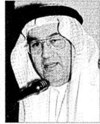
د. غازي القصيبي

بالنظر إلى حجم الاستثمارات التي تم إنفاقها على إنشاء المحطة الجديدة، فإنها تعتبر نموذجاً مثالياً للتخطيط والتوقع المبكر. حيث استضيفت المحطة العاشرة حال إنشائها (١٣٢٥) ميجاوات. وبين الدكتور غازي القصيبي أن قطاع الكهرباء بالملكة ما زال بحاجة إلى بذل الكثير من الجهد والعمل لكي يتمكن القائلون عليه من تلبية طموحات ورغبات المشتركين، حيث تسعى الوزارة بالتعاون مع هيئة تنظيم الخدمات الكهربائية والشركة السعودية للكهرباء إلى تنفيذ عدد من المشاريع والبرامج تمكنها من تلبية رغبات المشتركين وطموحاتهم، قائلاً: «الأمر ليس فقط طرح مشاريع أو إنشائها بل إن هناك أموراً كثيرة يجب أن تؤخذ في الحسبان لكي تتمكن من تقديم خدمة تلبي بالمشاركة وتلبي احتياجاتهم، في كافة الاجتماعات واللقاءات التي نتابع فيها خطوات عمل الشركة وأكد لهم ضرورة مراعاة احتياجات المشتركين ورغباتهم، وضرورة أن يرقى مستوى الخدمة الكهربائية إلى الحد الأمثل لتطلعات الدولة لغد أفضل لأبنائنا».